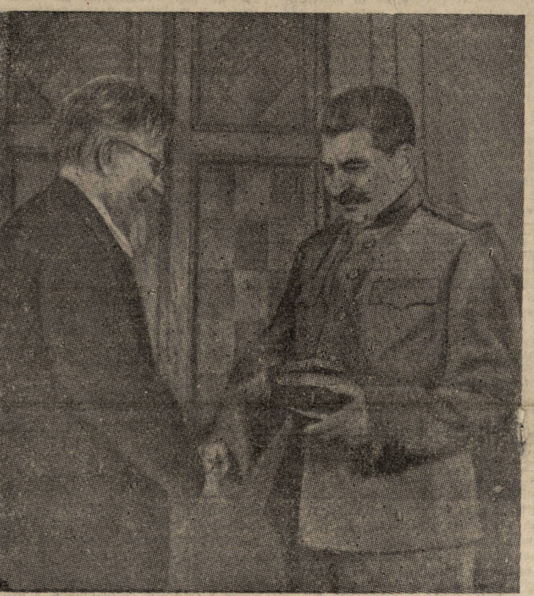
Mikhail Kalinin, en calidad de Presidente del Soviet Supremo de la U.R.S.S., hace entrega de la Orden de la Victoria al Generalísimo Stalin, Comandante Supremo de las Fuerzas Armadas de la Unión Soviética, y le felicita.

plamente representativo, que satisfaga al pueblo español e inspire confianza a todos los países, con los cuales España debe tener relaciones. Con este propósito, participamos en el Gobierno Giral y nos esforzamos en lograr su ampliación y reforzamiento. Los españoles democráticos no pedimos ni deseamos intervenciones extranjeras en nuestro país. Queremos que se repare la tremenda injusticia que se cometa con la República Española con la política de «no intervención» en la guerra de 1936-1939. Y la mejor ayuda que puede darse al pueblo español es facilitar su acción antifranquista, negando a Franco y a su régimen toda ayuda económica y política. El pueblo inglés, y especialmente los obreros ingleses, pueden ayudar eficazmente al pueblo español, logrando de su Gobierno la ruptura de relaciones diplomáticas con Franco, y negándose a trabajar en todo aquello que indirectamente sirva para reforzar las posiciones de Franco, el último satélite de Hitler en Europa. Y esto, no sólo en beneficio de la democracia española, sino como condición necesaria para la consolidación de la paz y de la seguridad en Europa y en el mundo.