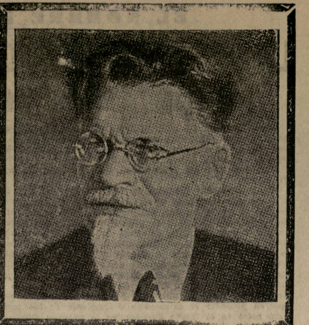
El pueblo español no olvidará la memoria del camarada KALININ gran amigo de la República Española. Telegrama de DOLORES IBARRURI AL Comité Central DEL Partido Bolchevique

«Permítame expresarle, en nombre del Comité Central del Partido Comunista de España y de todos los comunistas españoles nuestro profundo sentimiento por la muerte del camarada Kalinin, fiel compañero de lucha de Lenin y Stalin, infatigable combatiente por la causa de los trabajadores y por la libertad y fraternidad de los pueblos. El pueblo español, que lucha contra la tiranía franquista, nunca olvidará la memoria del camarada Kalinin, que en los días penosos y difíciles de nuestra guerra contra el fascismo, se mostró como un gran amigo de la República española.» Dolores IBARRURI.