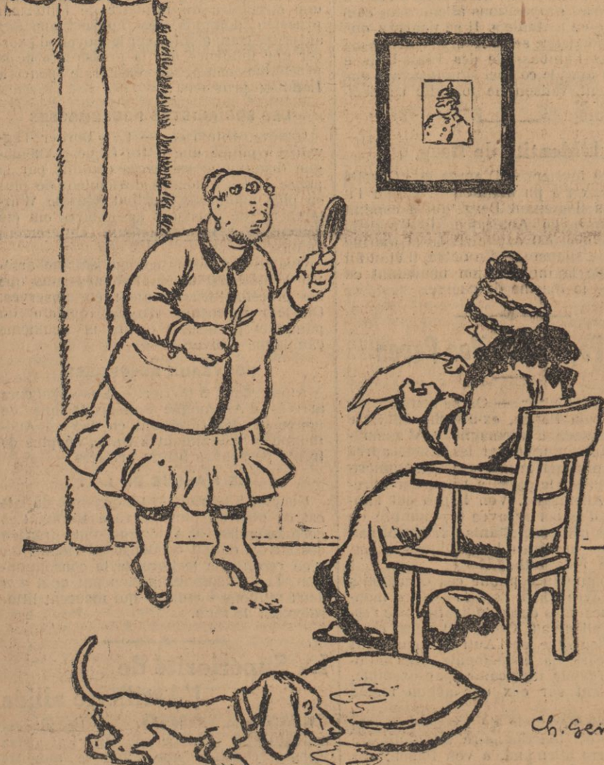
— Si ça continue, je me feras rasé. — Bonne précaution, Dorothee... Bienôt, notre empereur mobilisera les femmes à barbe !