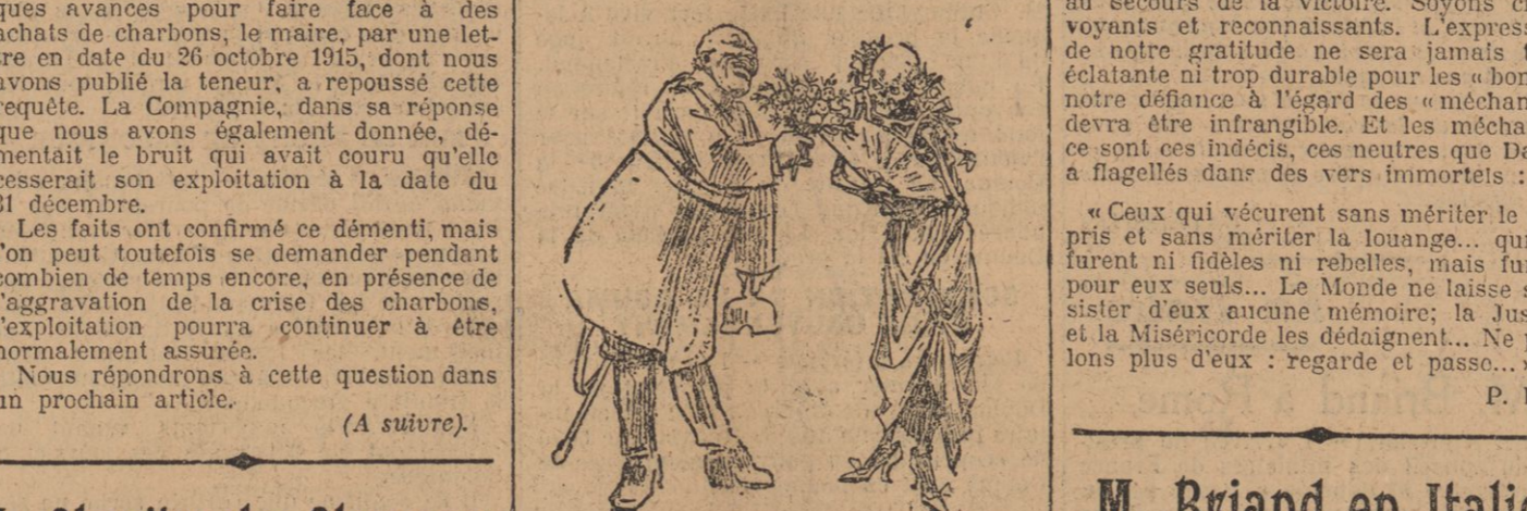
YON BERNHARDT A LA MORT

Vous êtes lasés généralement dans la mêlée à côté de nous. C'est que nous acclamons, c'est plus encore que le trait corseif du crayon la main qui se tend vers nous à l'heure de l'épreuve.