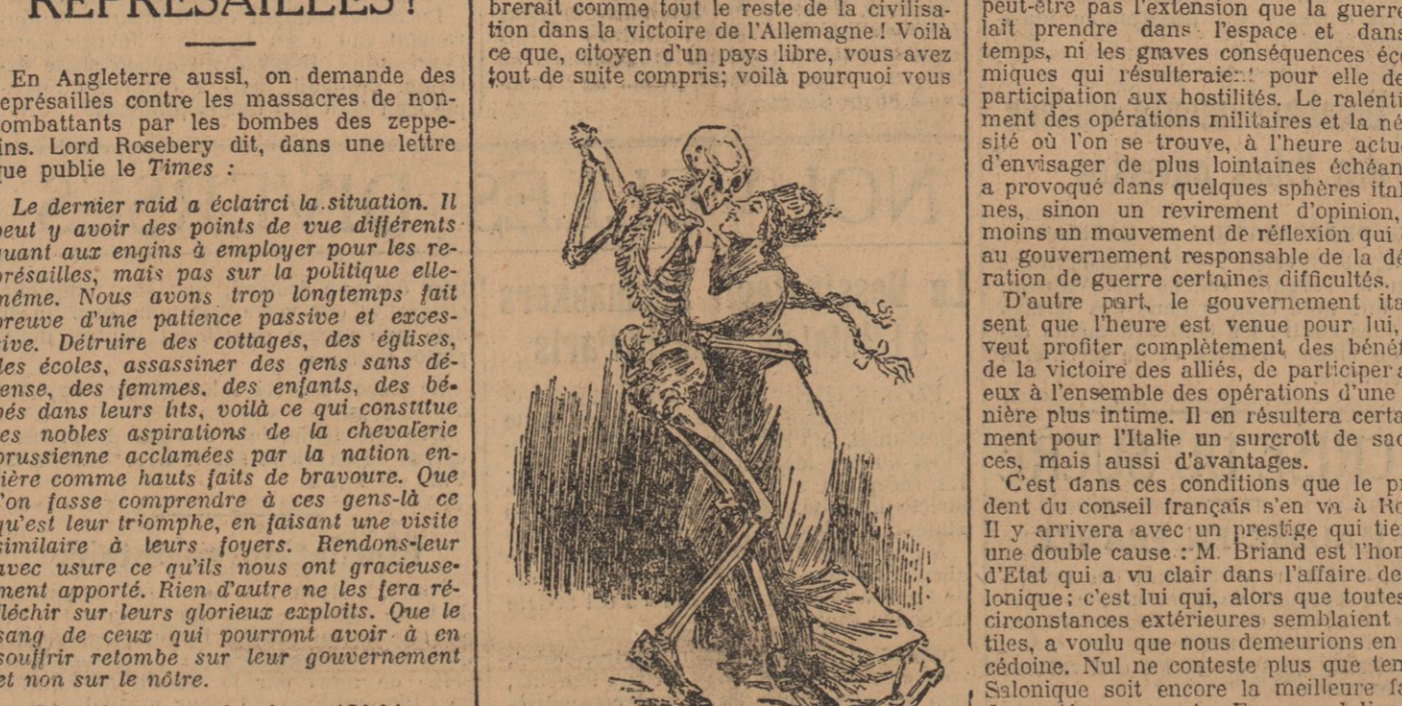
LA DANSE MACABRE

En Angleterre aussi, on demande des représailles contre les massacres de non-combattants par les bombes des zeppelins. Lord Rosebery dit, dans une lettre que publie le Times :