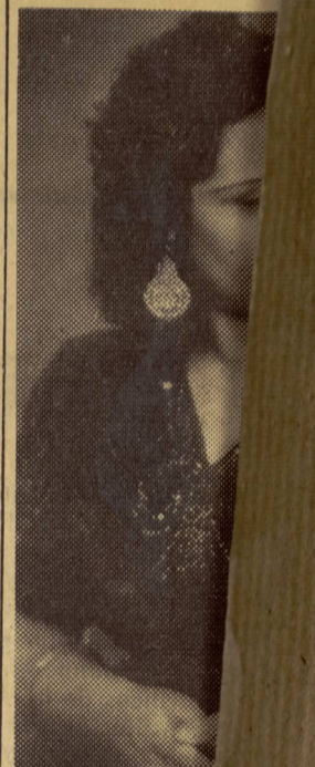
DE la corocida ved que, junto a F días con la Con en el Stud

El balance demográfico del Instituto de Estadística de Madrid correspondiente bre, arroja 1.575 nacimientos, de los que, según se suponen un aumento de 547. Comparadas estas cifras con las del año 1941, en brepas a la natalidad elocuentemente la favorable, que presenta un número de matrimonios un aumento de 45 cas