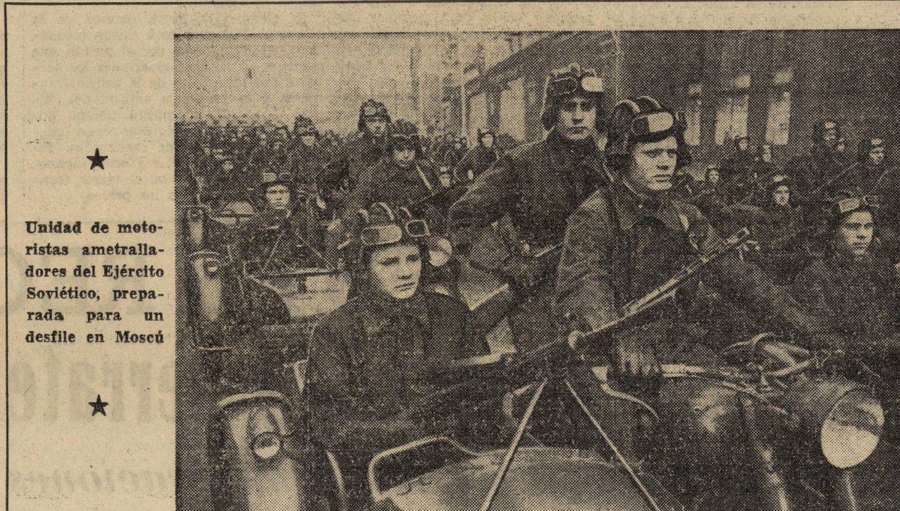
Unidad de motoristas ametralladores del Ejército Soviético, preparada para un desfile en Moscú

El repulsivo y embustero vocerío reaccionario alrededor de Mindszenty tiene la virtud de mostrar a todo el cotar de enemigos del pueblo en una coincidencia que el pueblo no dejará de ver y desenmascarar. Este escándalo goebbeliano debe ser puesto en la picota, con los hechos y las pruebas de la verdad, para que el pueblo, nuestro pueblo español, comprenda hasta qué profundidades de vileza y cinismo llegan sus verdugos franquistas, y con éstos los imperialistas y vaticanistas que apoyan a Franco, que dan el visto bueno a sus crímenes, que se apoderan de España y que fraguan contra la humanidad la amenaza de una nueva guerra de agresión y de intento de esclavización universal.