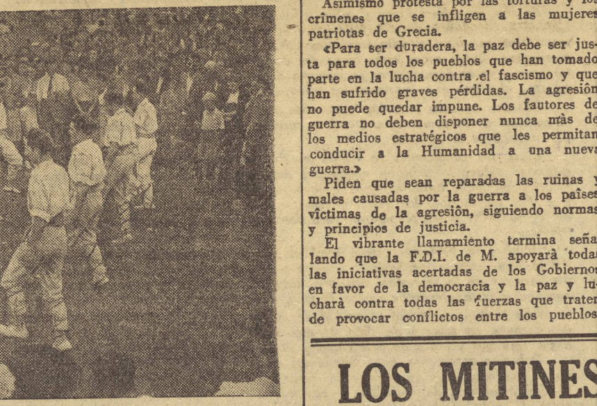
Vista de una actuación de los jóvenes «edantzaris» en Inglaterra.

internacionales, ha mantenido firmemente la justa posición de la ruptura de toda clase de relaciones con el régimen de Franco.