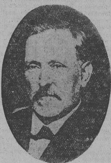
Juan B. Justo

Les Egaux, Fascio dei Lavoratori, el Centro Socialista Obrero y el Centro Socialista Universitario