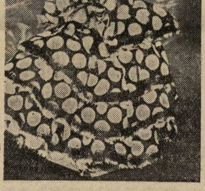
La Federación Democrática Internacional de Mujeres.

«Las organizaciones femeninas de más de cuarenta países expondrán en los «stands» como viven y trabajan las mujeres de sus países, sus creaciones de arte, sus luchas por la libertad.»