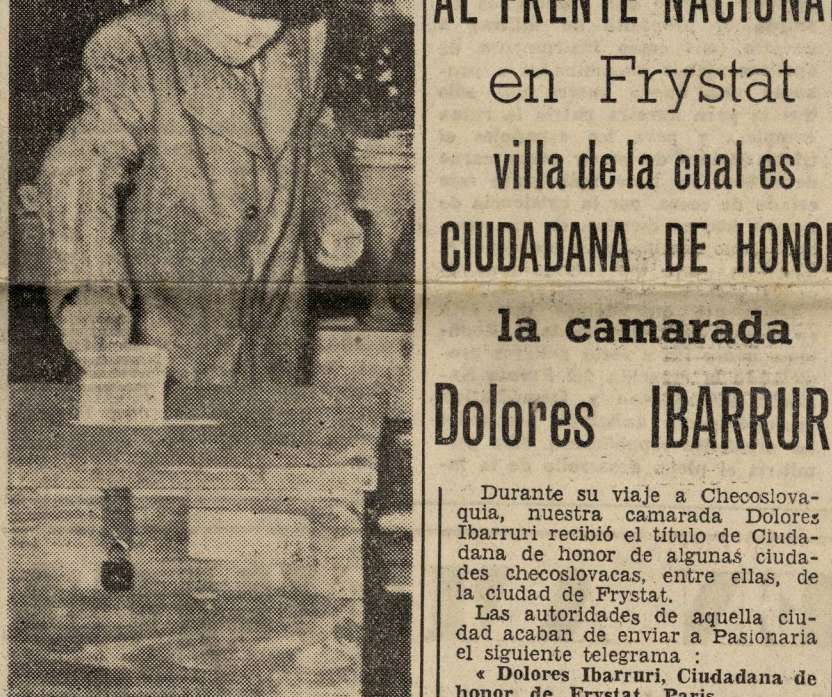
El camarada Clemente Gottwald, en el momento de depositar su papeleta de voto.

(Del llamamiento de la Agrupación Guerrillera de Levante y Aragón.)