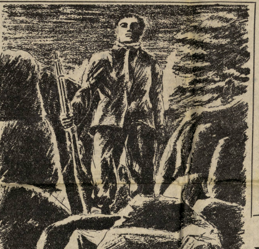
La sombra del centinela y sobre el risco, su fusil como un asta de bandera.

En nuestro último número, hacíamos mención de algunos Departamentos, que en algunos días de trabajo han conseguido aumentar el número de lectores. Esta semana tenemos que señalar nuevas pruebas de la actividad de los camaradas en este aspecto, y nuevos éxitos.