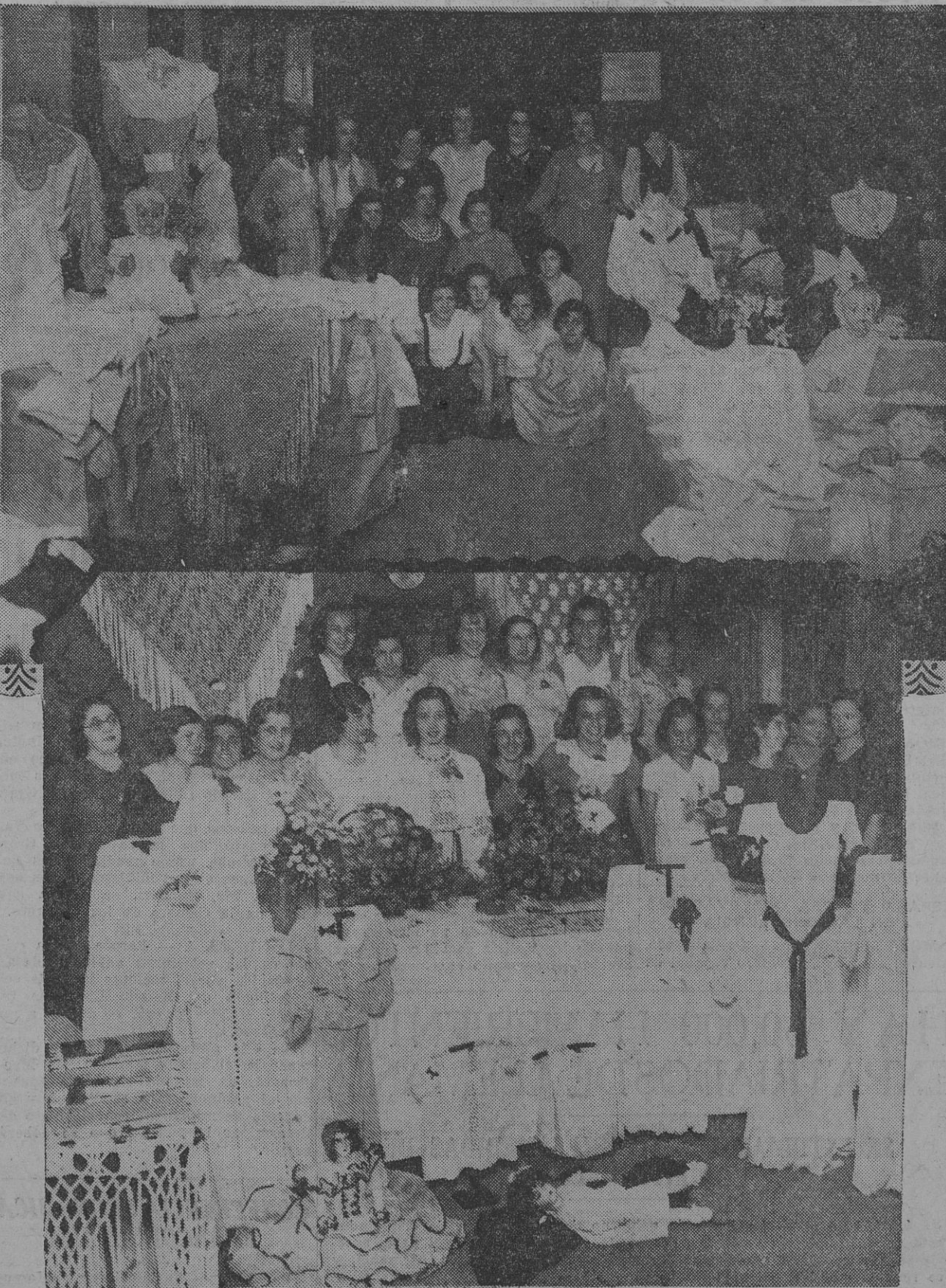
ARRIBA: Alumnas que asisten al curso de la biblioteca "Mariana Chertkoff y E. del Valle Iberlucea", del Centro de la sección 6". — ABAJO: Alumnas del curso de la Agrupación Femenina "Emancipación", del Centro Socialista de la Sección 12.