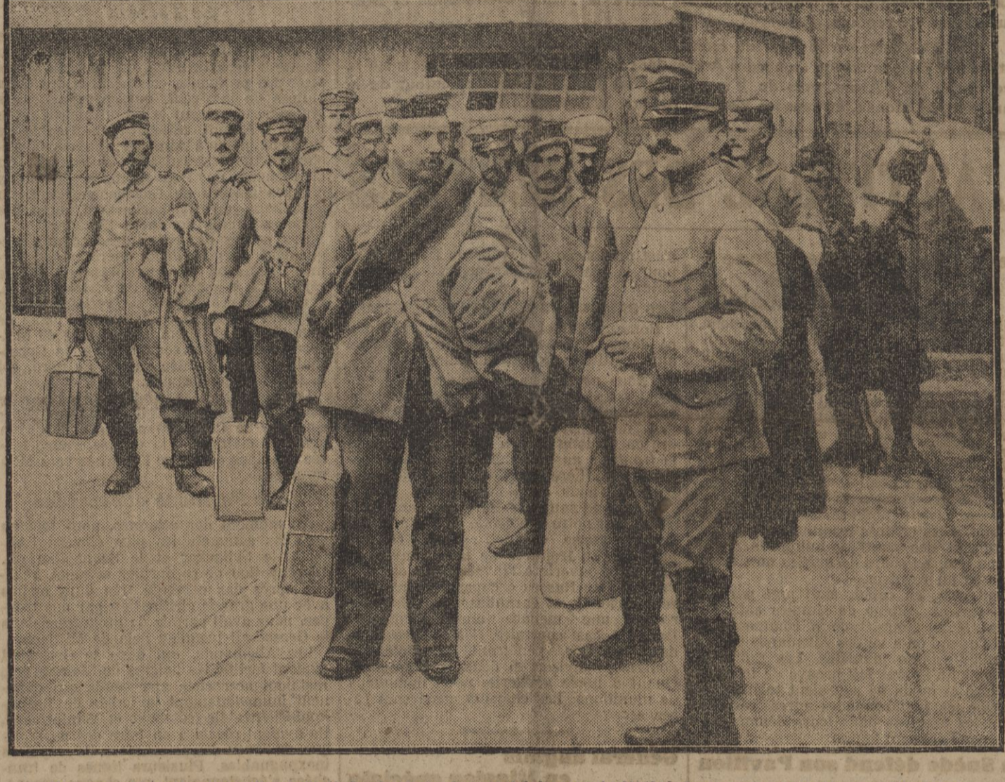
Un groupe de prisonniers allemands (infirmiers) s'embarquent à la gare du Midi, à Bordeaux, pour rentrer en Allemagne