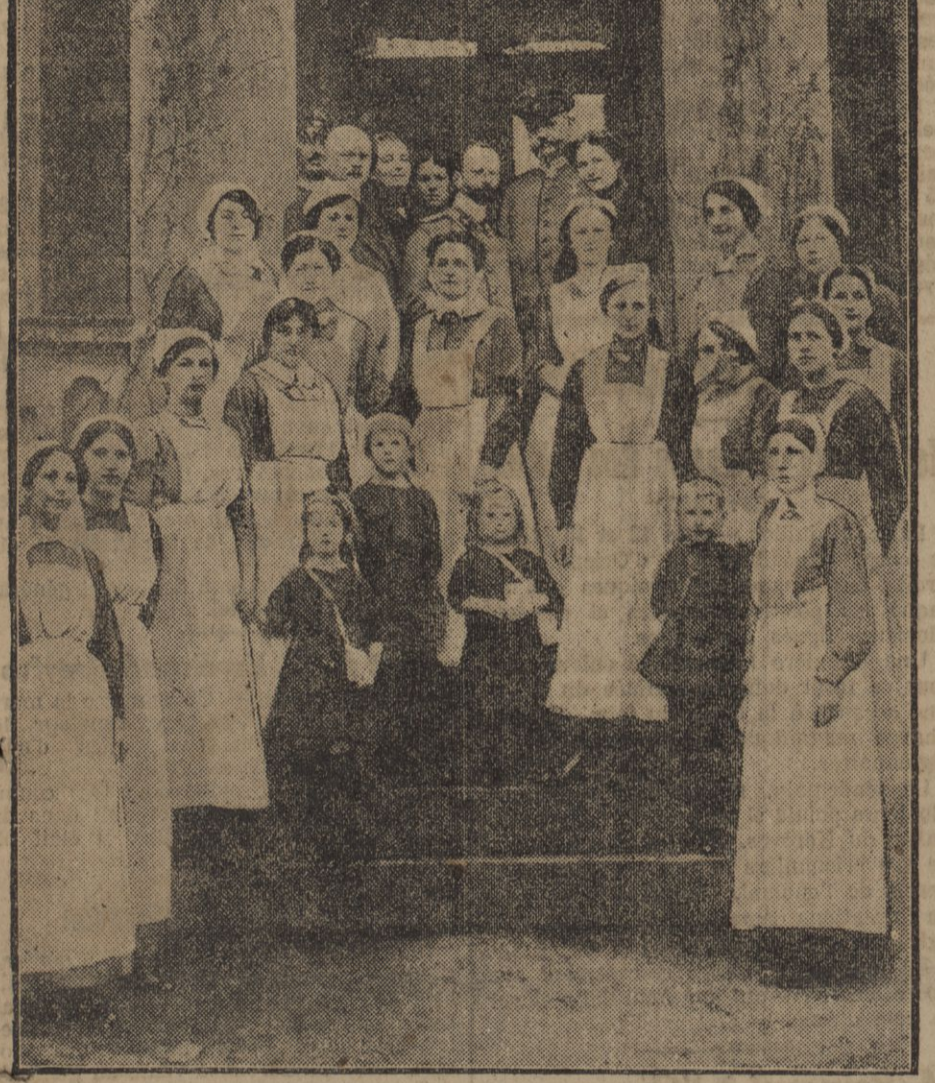
Le maréchal von Hindenburg (qui vient d'être disgracié) visite un hôpital