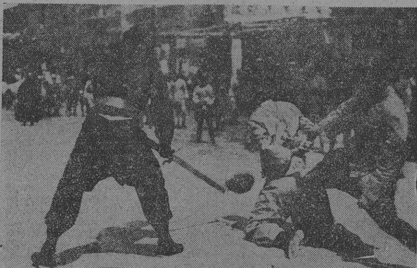
HACIENDO "JUSTICIA SOCIAL", VALE DECIR: DECAPITANDO al que protesta contra la opresión militarista.

de los colectores de impuestos una negativa de pagarlos en la escala exorbitante decretada por los satrapas provinciales. Las guardias de los terratenientes se llevaban en lugar de