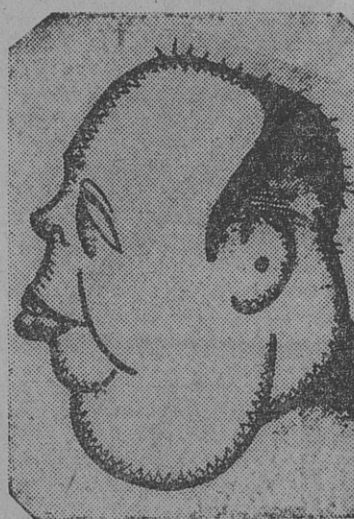
LIDER SOCIALISTA, A QUIEN LE FUE ENCARGADA LA TAREA DE FORMAR GABINETE

me rogó que aceptase la tarea de formar el nuevo gobierno. Mi respuesta ha sido categórica, aconsejándole que ratifique los poderes a Azaña, a lo que Alcalá Zamora hizo varias consideraciones por las que insistió en que yo me encargue de la tarea.