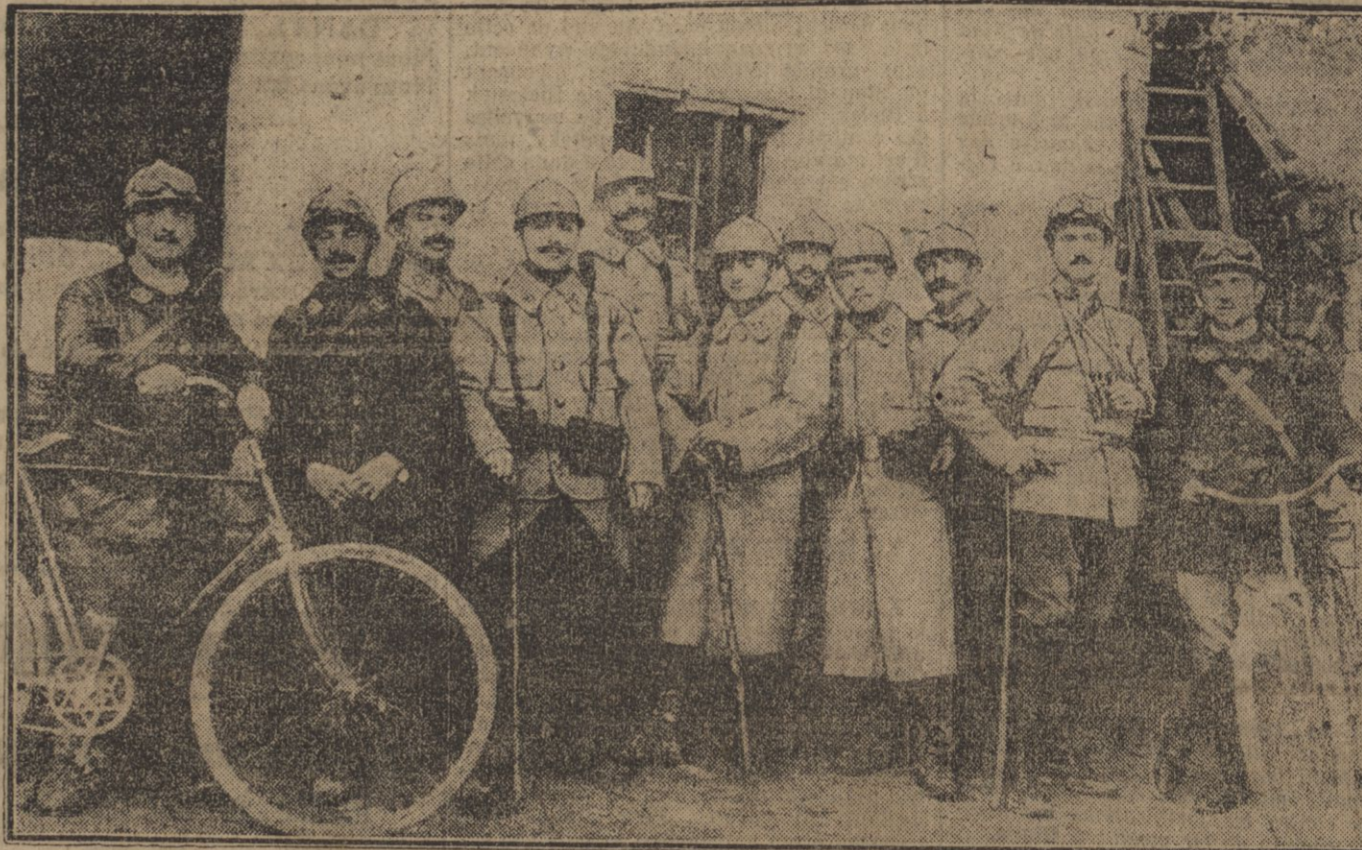
Cette photographie, que nous sommes les premiers à publier, représente le groupe des agents de liaison du 26 bataillon de 57e régiment d'infanterie de ligne...