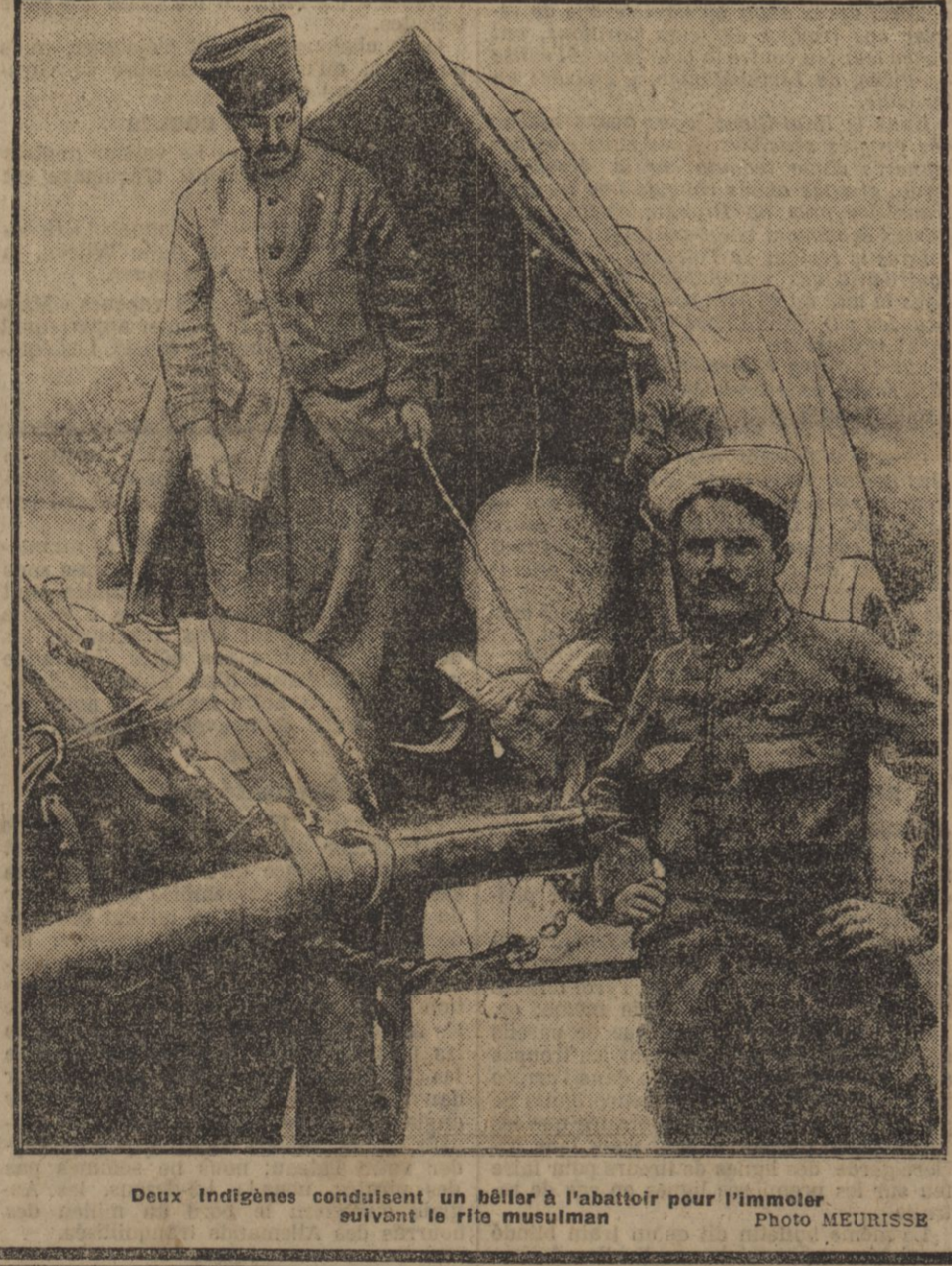
Deux Indigènes conduisant un bétail à l'abattoir pour l'immeuble suivant le fil musulman

FRUILLON DE LA PETITE GIRONDE DU 20 AOUT 1915