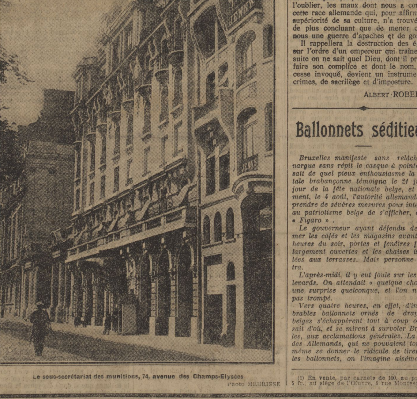
Le sous-secrétariat des munitions, 74, avenue des Champs-Élysées