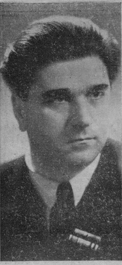
Gilberto VIEIRA, Secretario General.

Queridos camaradas: El Partido Comunista de Colombia saluda cariñosamente al glorioso Partido Comunista de España en el XXX aniversario de su fundación. El pueblo de Colombia vive actualmente bajo el terror de una dictadura reaccionaria que aplica los métodos bestiales de la Falange y del verdugo Franco y que ha sido impuesta por el imperialismo yanqui en desarrollo de sus planes de guerra y colonización. «La lucha por la liberación de los pueblos de España y de Colombia está ligada con la gran lucha mundial por la paz. Y las fuerzas crecientes del Frente democrático antimperialista, bajo la dirección de la Unión Soviética y del camarada Stalin, habrán de derrotar a los empresarios imperialistas de una nueva guerra y a sus chales, los Francisco Franco de España y los Laureano Gómez de Colombia. ¡Gloria eterna a la memoria de José Díaz! ¡Larga vida a Dolores Ibarri! ¡Viva el glorioso Partido Comunista de España!