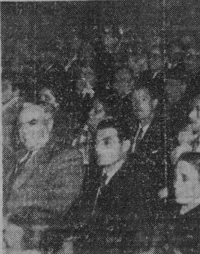
Un grupo de asistentes al gran mitin de Marsella.

Por la tarde se celebró, en medio de la mayor alegría, un festival en el que participó el grupo artístico de la J.S.U.