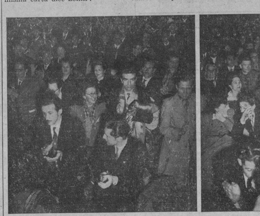
Dos vistas parciales de la sala Pleyel durante el gran acto del 15 de abril.

Qué cosa más distinta lo que es la dictadura del proletariado de lo que dicen esos canallas que andan por ahí sueltos. (Aplausos). Así pues, el objetivo de la dictadura del proletariado, y para eso la clase obrera toma el Poder, es poner fin a la sociedad dividida en explotadores y explotados. Poner fin al dominio de una minoría, crear la sociedad sin clases. Terminar con las clases parasitarias que viven a costa del sudor de la mayor parte del pueblo. Lograr la libertad y una verdadera democracia para los trabajadores que se ven privados de ella en el régimen capitalista. La implantación de la dictadura del proletariado no significa que se ha acabado la lucha de clases. En la misma carta dice Lenin: