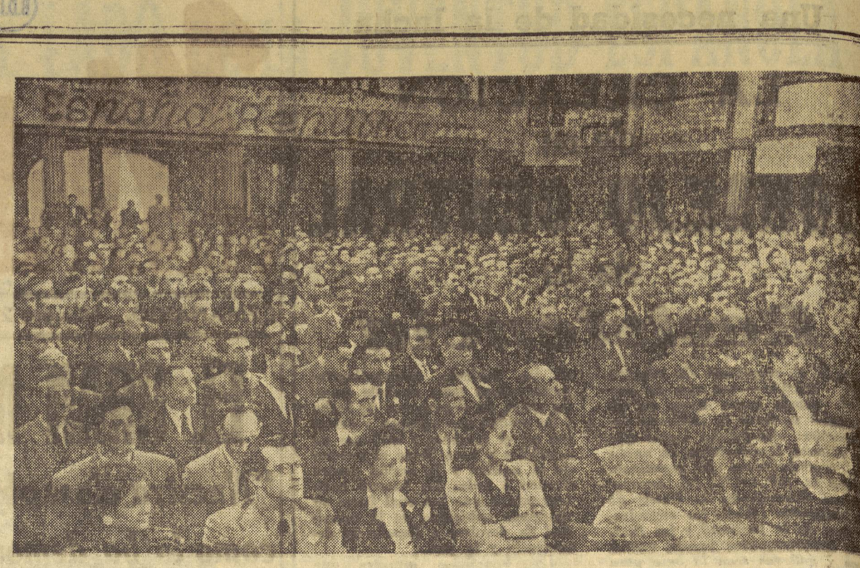
Un aspecto de la sala Wagner durante el mitin celebrado el pasado domingo.

En estas movilizaciones merecen ser recordados los casos como los de Cabestany, en donde dos camaradas, acompañados de diez españoles más, vienen a pie al mitin; Paols, cinco camaradas son acompañados en autocar por 30 españoles, y esta misma horda es la consiguiente en los Prales, Górriz, Elne, Port-Vendres, Rivesaltes, St-Paul de Fenouillet, Estael, etc., la representación de nuestra organización de la Gerdaque, de la que, a pesar de la distancia, acuden 10 españoles.