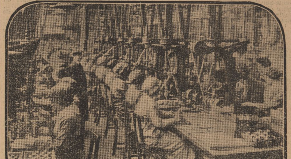
LA FABRICATION DES FUSEES

En Écosse. — Dans les Usines de Glasgow. The Right man... Les Obus de la Justice. — Au Royaume des Monstres de la Guerre. — La Naissance d'un 331.