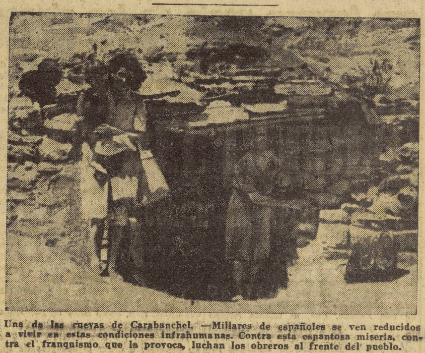
Una de las cuestas de Carabanchel. —Miles de españoles se ven reducidos a vivir en estas condiciones infrahumanas. Contra esta espantosa miseria, contra el franquismo, que la provoca, luchan los obreros al frente del pueblo.

Salta como un latigazo a la cara de quienes pretenden ignorarlo para llevar a cabo sus piteos desingsos de capitulación. ¿Que el pueblo no lucha? ¡Ah! está la respuesta de nuestros obreros, de nuestros campesinos, que dicen con hechos cómo es posible combatir contra el fascismo, que señalan el camino para triunfar. Harán bien en mirar hacia ese ejemplo quienes, por tener la vista puesta en otra parte, no advierten más que negruras. La lección viene de España. Viene de esos abnegados combatientes de nuestros obreros y de todas las masas populares por obtener mejores condiciones de vida y minar al mismo tiempo las bases del régimen. Se trata para todos los antifranquistas de aprovechar esta lección; de aportar al esfuerzo de los heroicos antifranquistas que luchan en el interior, la contribución de nuestra unidad combativa, cada vez más firme, la decisión de estimular más y más la gran movilización democrática mundial en favor de nuestra causa y la de impulsar con todas nuestras posibilidades el combate por la República, por la restauración de la democracia en España.