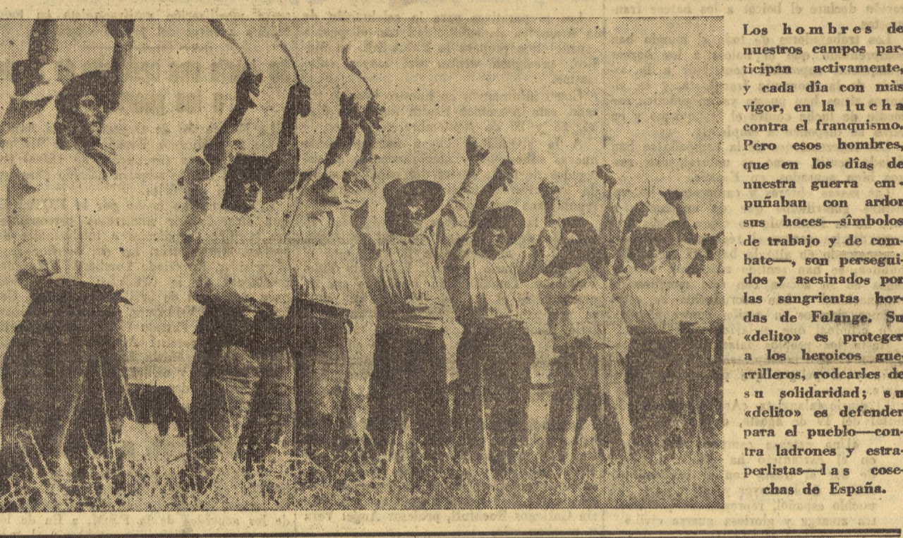
Los hombres de nuestros campos participan activamente, y cada día con más vigor, en la lucha contra el franquismo. Pero esos hombres, que en los días de nuestra guerra empuñaban con ardor sus hoces—símbolos de trabajo y de combate—, son perseguidos y asesinados por las sangrientas hordas de Falange. Su «delito» es proteger a los héroes guerrilleros, rodearles de su solidaridad; su «delito» es defender para el pueblo—contra ladrones y estraperlistas—las cosechas de España.