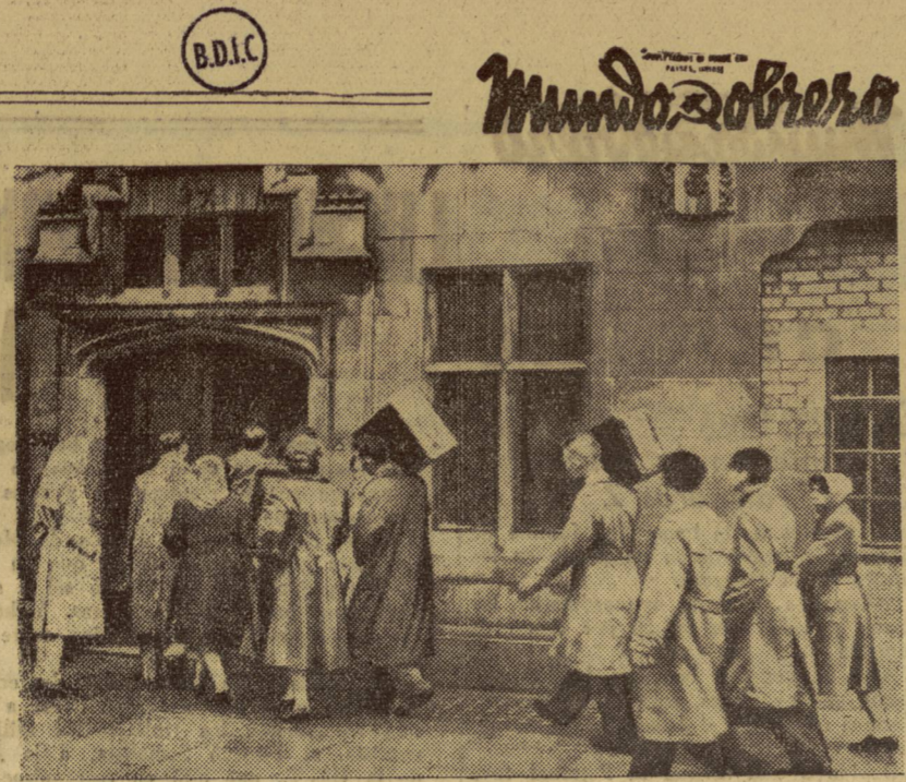
Grupo de londinenses que se encontraban sin alojamiento en el momento de ocupar la casa deshabitada perteneciente a la duquesa de Bedford.

Administración: 15, rue Lafayette, París-10 a .