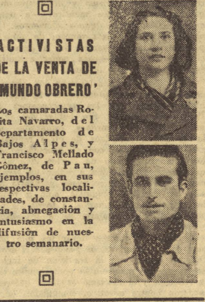
Activistas de la venta de 'Mundo Obrero'.

Se inicia una campaña de ayuda a los guerrilleros La Federación de Organismos de Ayuda a los Republicanos Españoles, de Méjico, ha iniciado una suscripción de 15.000 pesos con el fin de adquirir calzado para los guerrilleros españoles.