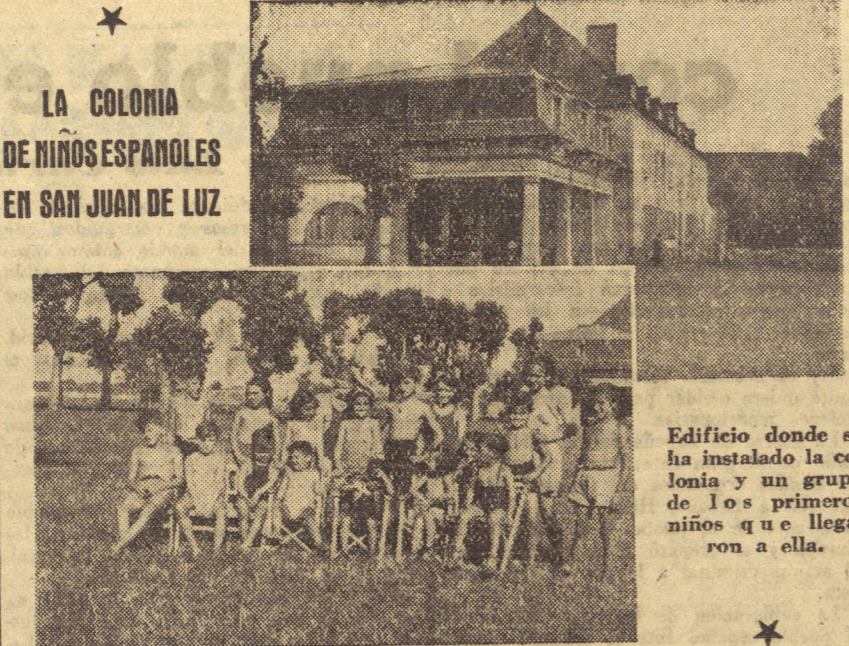
Edificio donde se ha instalado la colonia y un grupo de los primeros niños que llegaron a ella.