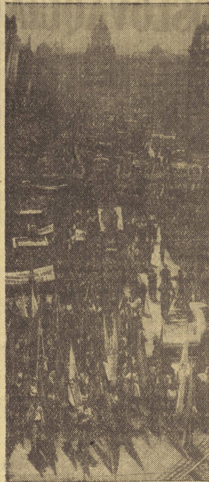
Perspectiva de la vía principal de Praga durante una de las manifestaciones que se han celebrado recientemente en la capital checoslovaca en favor del pueblo español.

Los obreros de la fábrica «Santa Ana» han presentado distintas reivindicaciones a la Empresa. La actitud unánime de los obreros, que han actuado dirigidos por el Sindicato clandestino de la U.G.T. en la fábrica, ha hecho que la Empresa se haya visto obligada a ceder ante la amenaza de huelga que los obreros plantearon para el caso de que sus peticiones no fueran aprobadas. De este modo los trabajadores han conseguido que les fueran facilitados monedas para el trabajo y botas, así como un racionamiento suficiente y una justa clasificación del personal. Quinientos mineros se encierran en una mina: «Queremos más comida», dicen.