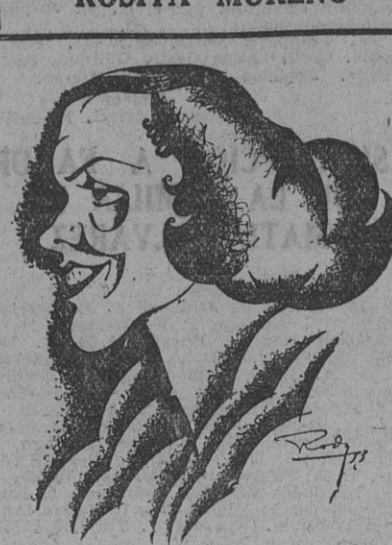
LA SIMPATICA "VEDETTE" MEXICANA, de tan lucida actuación en el Malpo, que hoy se despidió del público porteño.