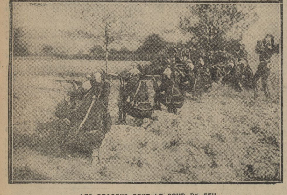
LES DRAGONS FONT LE COUP DE FEU

Les Procédés allemands dans la Guerre économique Un Congrès international des Chambres de Commerce qui se tint à Paris au mois de juin dernier, en ramassant la présence d'un grand nombre de délégués allemands. Un membre du Reichstag et secrétaire général du 'Deutsche Handelsrat' ou comité national du commerce, se montra particulièrement désireux d'assurer les relations les plus cordiales entre les commerçants français et allemands, et on eut dit qu'il prenait tâche de multiplier les efforts en ce sens.