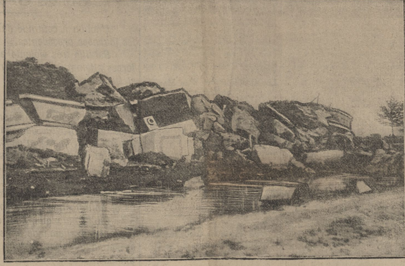
Avant d'évacuer Anvers, les Belges ont détruit les défenses de la place. — La photographie ci-dessus représente le fort d'Etterbanc, que sa garnison a fait sauter.