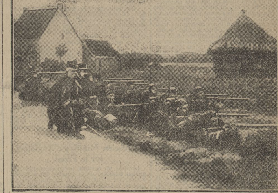
INFANTRIE BELGE DANS UNE TRANCHÉE

Il conserve son sang-froid, commande pendant deux heures entières, s'évanouit et, longtemps après la retraite, son sergent et son caporal viennent le rechercher et le sauvent.