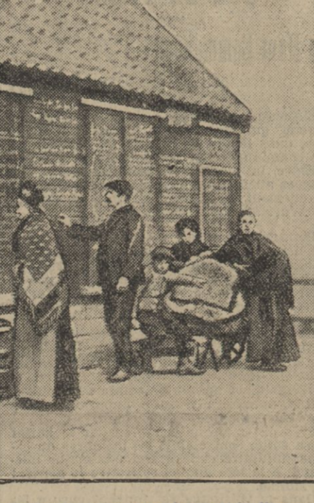
Avant de quitter leur pays, des Belges écrivent sur un mur le nom du lieu où ils se rendent.