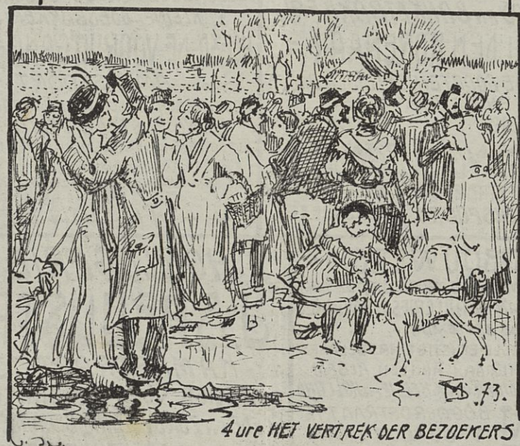
4 ure HET VERTREK DER BEZOEKERS

Niet alleen kunnen kogels in het lichaam van gewone den blijven, zonder dat ze daarvan eenigen hinder heb: ben, maar ook andere, "sow-mis" kunnen rij van 't slagveld in hun lichaam verbergen meebrengen. Dikwijls weten zij het niet eens. Zoo werd in 1893 te Keulen, in het Burgeraichen: huis, een 47-jarige man geoperceerd, die sedert den slag bij Königgratz, dus langer dan een kwart eeuw, een 33 cm M. lange punt van een sabel in zijn li: chaam hart meegedragen. Dit punt was door een granaatscherf van de sabel afgeslagen. De gra: naatscherf werd verwijderd, maar van het stuk sabel wist men niets. Na 20 jaar vertoonde zich