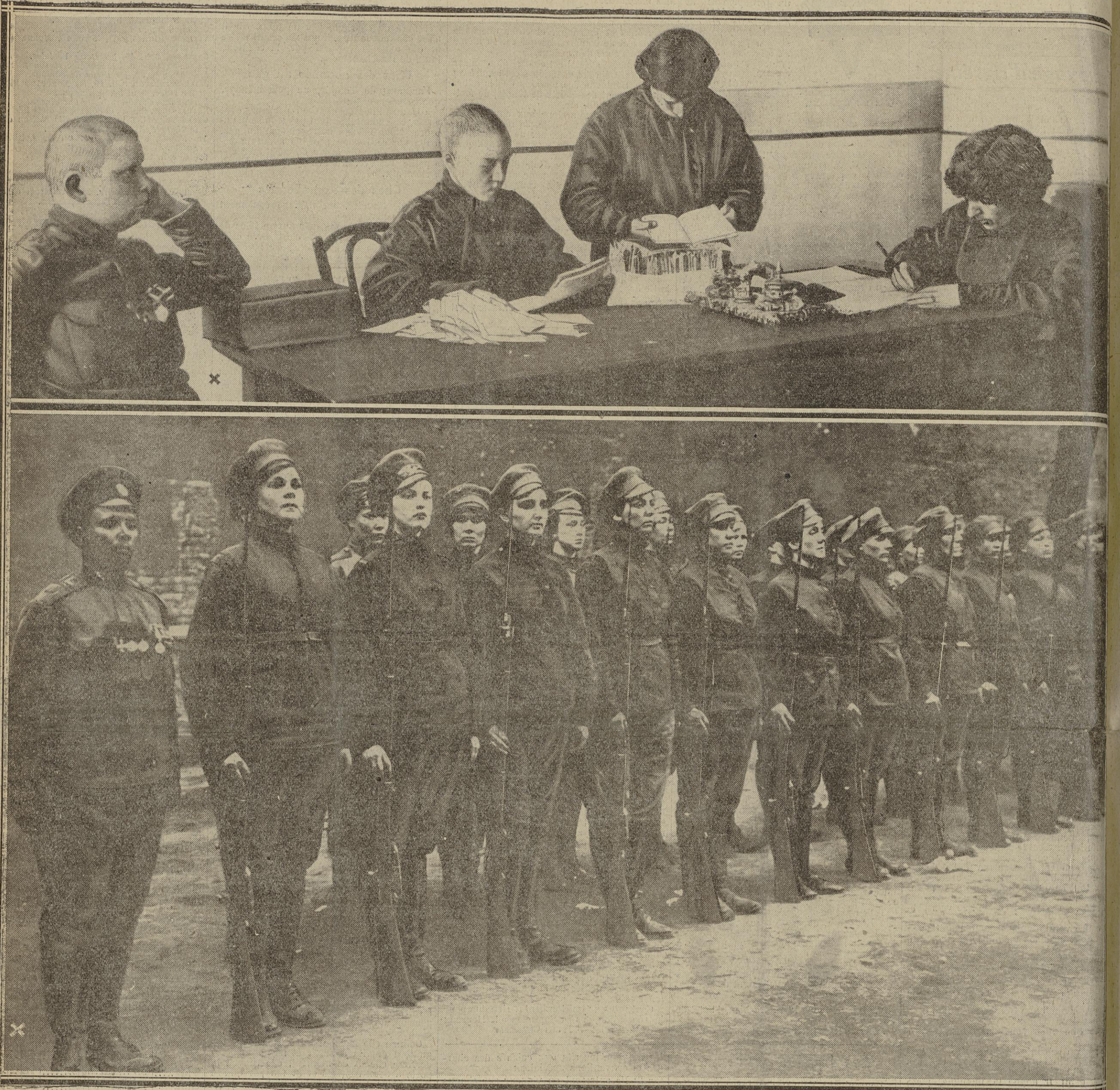
LA "COMMANDANTE", M me BOTCHKAREVA (X) AU SECRETARIAT DU "BATAILLON DE LA MORT", ET LES HEROINES AU PORT D'ARMES On a appris hier que dans les combats, entre Smorgone et Krevo, le fameux bataillon féminin russe a fait, à lui seul, une centaine de prisonniers. M me Botchkareva, qui le commande, a été blessée. Veuve d'un colonel, cette femme s'engagea en 1914 comme soldat. Son état-major est composé d'intellectuelles diplômées qui se battent depuis trois ans. Les "soldates" ont été formées en trois semaines d'une instruction intensive. Voici le secrétariat du bataillon et les femmes à l'exercice. A gauche, M me Botchkareva.