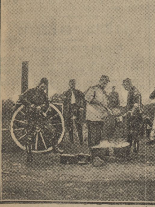
LES CUISINIERS PRÉPARENT LE REPAS DES SOLDATS.

EMPEREUR DU MONDE! Dans leur retraite précipitée et désordonnée, les Allemands emportent en nombre considérable la traversée de Reims. Les rémois, dont la ville avait été durant tout le jour occupée par les Allemands, eurent alors dans l'ivresse de la délivrance la joie de voir défiler, ridicules dans ce moment, les véhicules militaires qui portaient cette arrogante inscription: « Wilhelm der zwelte, Kaiser der Welt ».