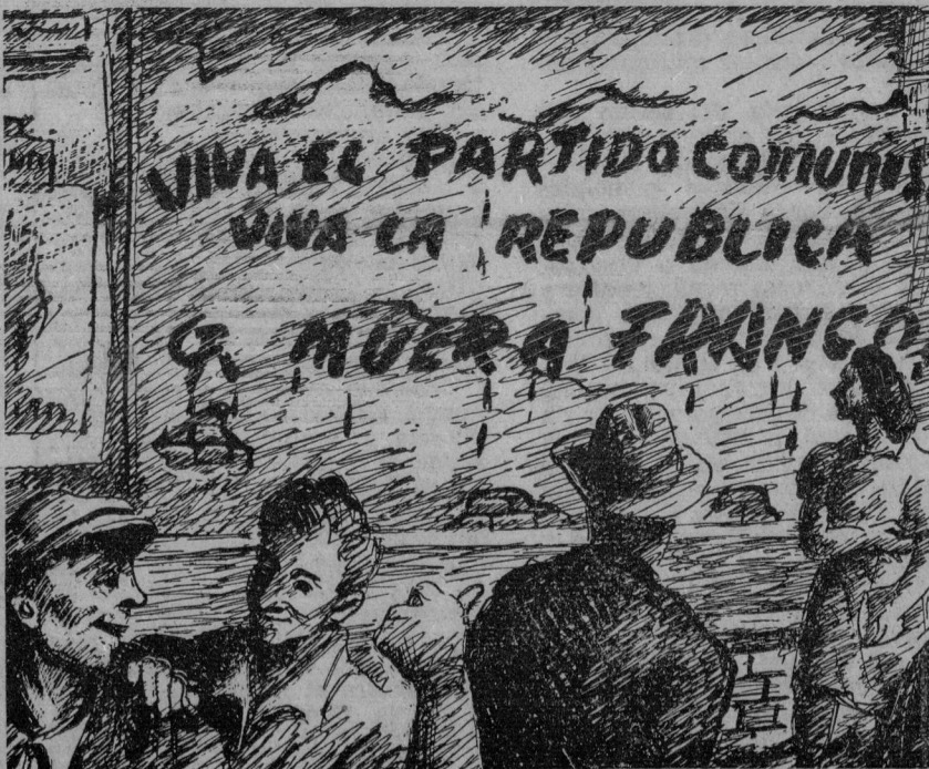
Letreros en los muros de Madrid. (Dibujo por Ceballos).