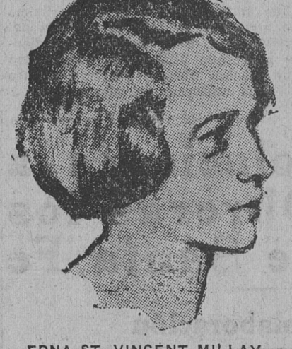
EDNA ST. VINCENT MILLAY

PARA ubicar en el panorama literario de Estados Unidos a la insignia poetisa Edna St. Vincent Millay — cuya es la poesía que transcribimos — recordaremos la clasificación de la literatura norteamericana propuesta por Edmund Wilson en un artículo aparecido en "The New Republic", de Nueva York (1928). Edmund Wilson señala cinco "partidos" en la literatura norteamericana, cinco grupos fuertes con orientaciones y métodos definidos: 1) Mencklen, "con su satélite Nathaniel, su discípulo Sinclair Lewis, su taller literario "The American Mercury"; 2) T. S. Eliot, residente en Inglaterra pero con poderoso influjo en su patria nativa a través de su revista "Criterion"; 3) el grupo, poco organizado, de los que cabría llamar neo-románticos, cuyos jefes actuales son Edna St. Vincent Millay y Scott Fitzgerald y cuyos precursores son, entre otros, el novelista Hergesheimer, Sara Teasdale, poetisa de emoción delicada, quizá Cabell; 4) el partido, bien unificado, de la Revolución social: Lawton, John Dos Passos, Michael Gold... con su revista "The New Masses" y su Teatro de los