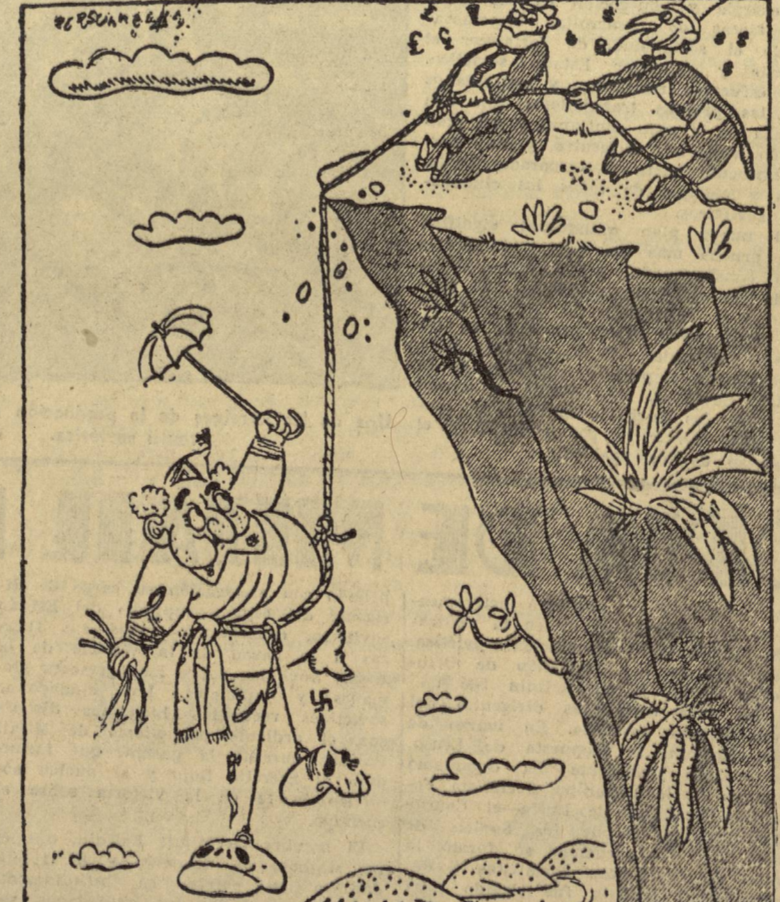
Caricatura publicada en «La Hora» de Buenos Aires órgano del Partido Comunista Argentino.

Es tal el temor y la criminalidad de los falangistas de las fuerzas represivas franquistas, que creen ver guerrilleros en todas las esquinas, que sin el menor de los avisos tirótean en las calles a los ciudadanos a la mínima de las sospechas.