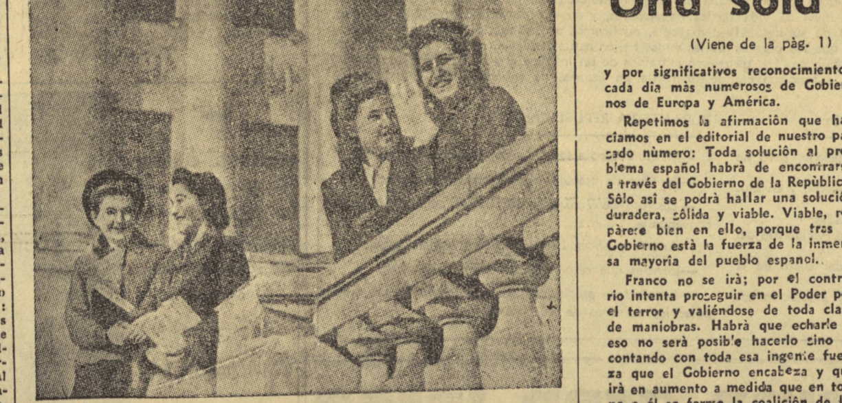
Muchachas españolas con sus compañeras soviéticas, a la puerta de un centro docente de Moscú, donde cursan sus estudios.