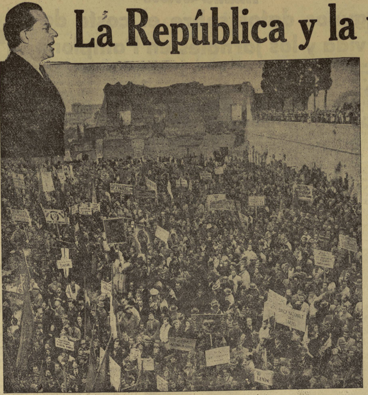
El camarada Palmiro Togliatti, Secretario General del Partido Comunista Italiano, hablando al pueblo de Roma