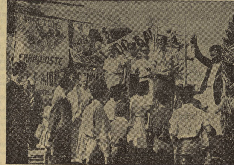
La tómbola de los comunistas españoles en la fiesta organizada por «L'Avenir», órgano del Partido Comunista Tunecino.

Luego es verdad que se tortura, y no solamente en las Comisarias y en el fatídico caserón de Gobernación, sino también en los presidios.