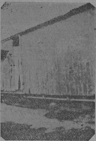
CAMPO LARGO, VIVIENDA DEL auxiliar estación y familia, vagón tiene techo de zinc únicamente

La comisión de fiestas ha preparado un interesante programa.