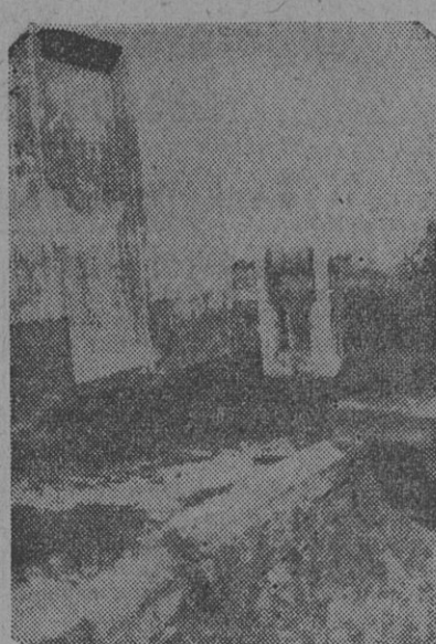
CASILLA DE GUARDABARRERA, lado sud, de R. S. Peña. Como podrá observarse, el funcionamiento de las barreras es efectúa desde afuera; no habiéndose tenido en cuenta las inclemencias del tiempo

Sobre el particular, podemos adelantar que no está lejano el día en que los trabajadores ferroviarios del estado constituyan uno de los sillares más poderosos de sus respectivas organizaciones.