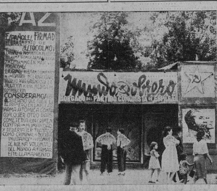
El stand de MUNDO OBRERO en la verbera de Toulouse.

Así, poniendo en pie, organizadas y unidas, las inmensas energías de nuestro pueblo, podremos desahcer los siniestros planes de guerra que los imperialistas y su peon franquista se han trazado para España.