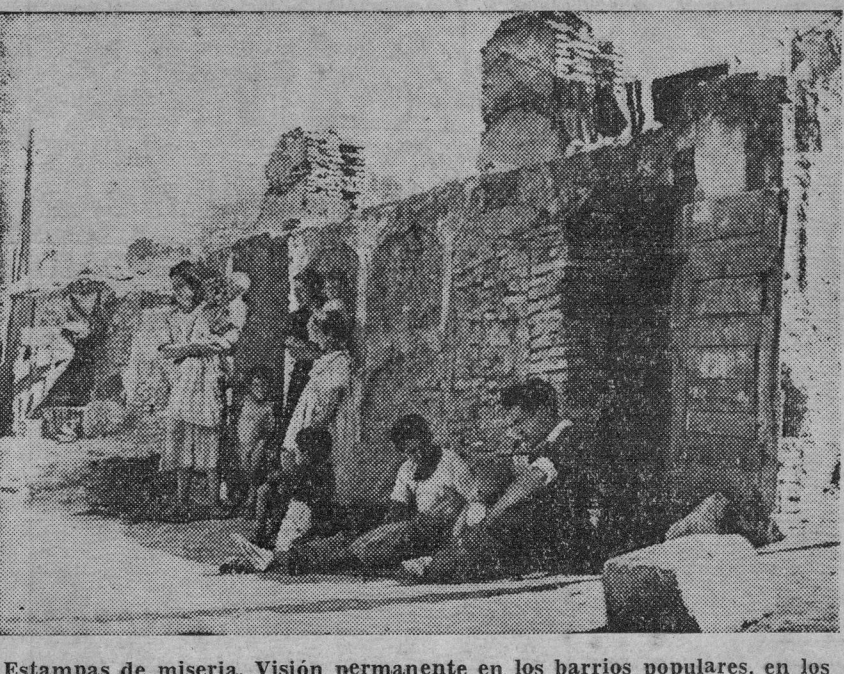
Estampas de miseria. Visión permanente en los barrios populares, en los suburbios de las ciudades españolas bajo el franquismo.

FRENAR la lucha por la libertad de nuestro pueblo; defender con uñas y dientes el sistema capitalista de explotación del hombre por el hombre y el régimen franquista que es su manifestación fascista en España; eso es lo que la Iglesia pretende conseguir intensificando cada día más su propaganda entre la clase obrera, especulando groseramente con la religión. Pero sólo más aversión y más odio cosechará la Iglesia con sus nuevas e intensificadas maniobras. Los obreros españoles, creyentes y no creyentes, unidos contra sus comunes explotadores, en pro de sus comunes reivindicaciones, proseguirán como hasta aquí, con más fuerza que hasta aquí, forjando su organización y ampliando sus luchas, para avanzar por el camino que les conduzca, con el Partido Comunista al frente y junto a todo el pueblo, al derrocamiento del franquismo y a la instauración de un régimen republicano y democrático que abra nuevas vías de progreso social.