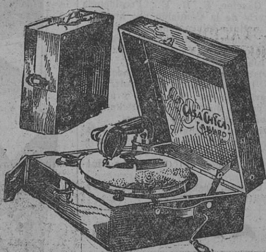
Portátil Sport N.º 9

Caja 33x33x12 1/2. Bille oscuro a precio de propaganda ... 35