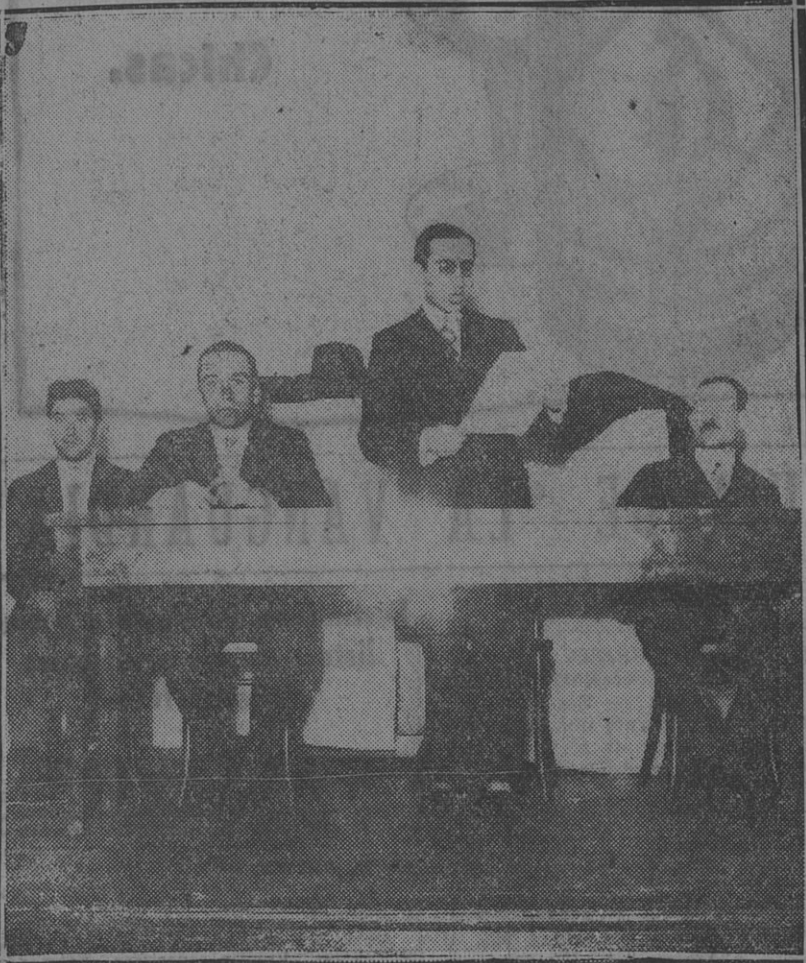
LA MESA DIRECTIVA INFORMA A LA ASAMBLEA POR INTERMEDIO del secretario general

tiempos se creían eximidos del cumplimiento del convenio realizado con la Federación. Expresó que una forma eficaz de evitar esas infracciones sería la implantación de una libreta como la que el Departamento nacional del trabajo había entregado al personal de las empresas de mudanzas, control que sería obligatorio. Terminó pidiendo a los asambleístas opinaran ampliamente sobre el particular.