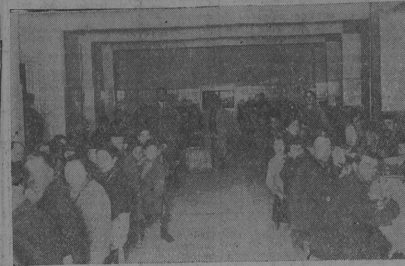
COMEDOR DE DESOCUPADOS