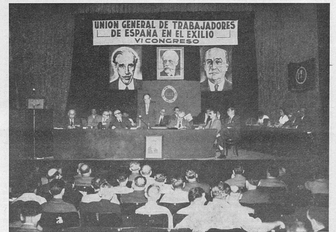
La Mesa del VI Congreso de la U.G.T.