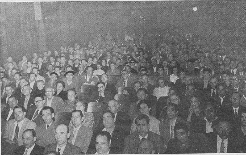
Una vista de la sala con los delegados durante la celebración del VI Congreso