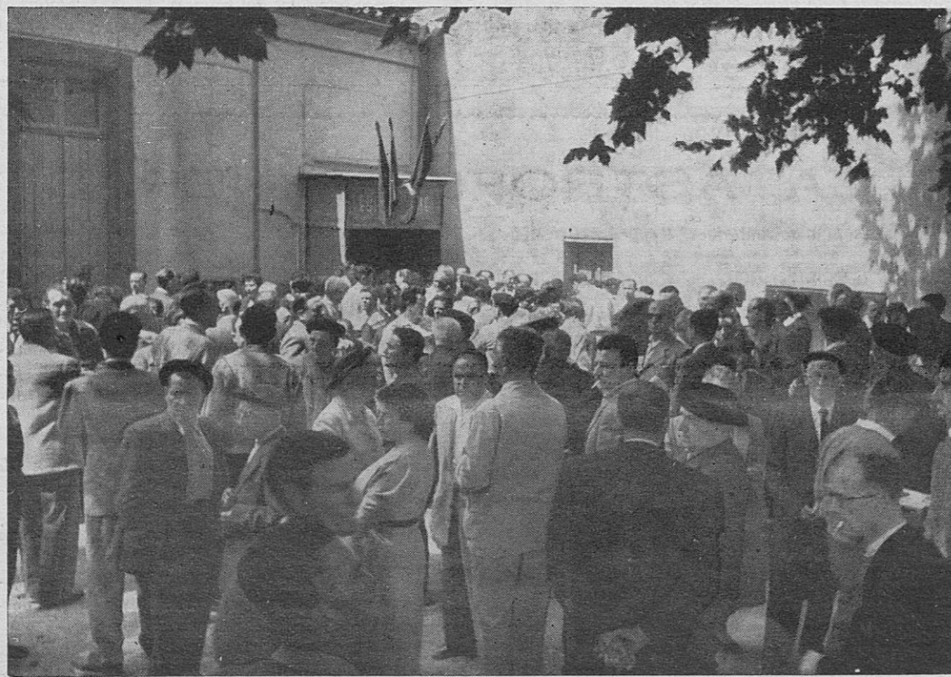
Los delegados y otros compañeros antes de comenzar el mitin

Y por último, este Congreso debe de tener muy en cuenta, ésta es nuestra opinión, que sobre nosotros Partido y Unión —dejemos el Partido— sobre la Unión estarán atentos los ojos de los españoles y de otros observadores que no son españoles pero también preocupados por la situación y el futuro de España. Unos, los españoles, desde dentro más todavía que desde fuera, esperando que las resoluciones que aquí adoptemos puedan alimentar la esperanza profunda que hoy tienen y decir que no se han engañado al pensar que la Unión les puede ofrecer la garantía de una España mejor y otros los del régimen a la caza de cualquiera expresión, de cualquier acuerdo, de cualquiera violencia verbal que aquí se pronuncie y con esto, compañeros, no me hareis la injuria de creer que queremos limitar la libertad de expresión de nadie, a la caza de cualquiera expresión violenta verbal que pueda ser explotada ahí dentro para decir: como no se entienden esa fuerza a la que vosotros, los opositores concedéis tanta importancia, como tienen un programa que es inaplicable dada la situación que en España existe, no hay más remedio que aceptar lo que hoy existe porque con lo que acaban de hacer en el Congreso de Toulouse, en vez de facilitaros la tarea, lo que han hecho es darnos a nosotros la seguridad que en España no se puede cambiar porque no hay nadie preparado para ello.