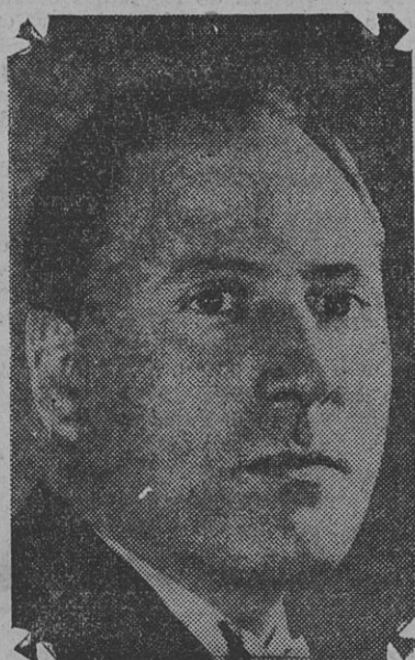
Diputado Fco. PEREZ LEIROS