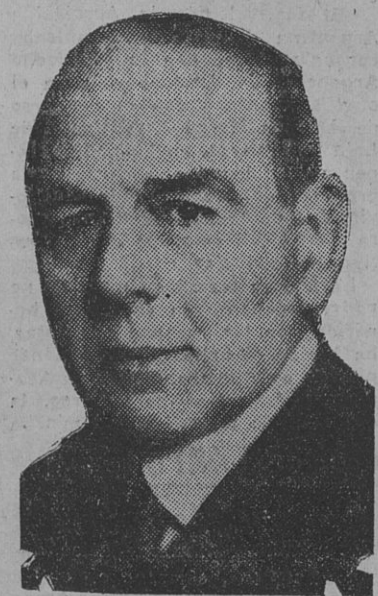
Diputado NICOLAS REPETTO