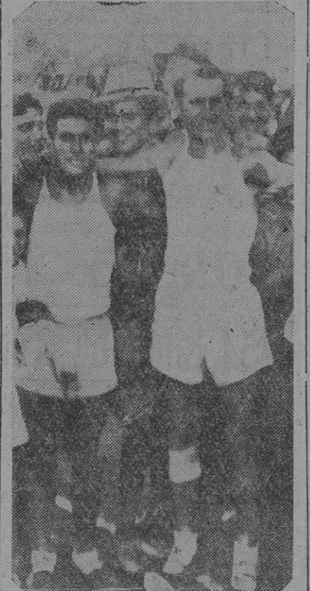
JUAN CARLOS ZABALA Y JOSE RIBAS , primera y segundo, respectivamente, en la carrera de los 10.000 metros, en la cual Zabala batió el record latinoamericano, en 31' 19".

que constituían el programa contribuyeron a que una elevada cantidad de aficionados se ubicara en las tribunas del estadio, invadiendo por último la pista buscando una mayor comodidad.