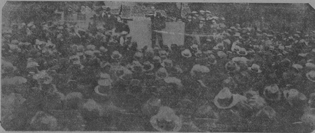
EL PUEBLO RODEANDO LA TRIBUNA SOCIALISTA

mundo nuevo", la que fué muy comentada por los concurrentes. En esta la primera vez que se conmemora en Mones Cazón el Día de los Trabajadores. — Corresponsal.