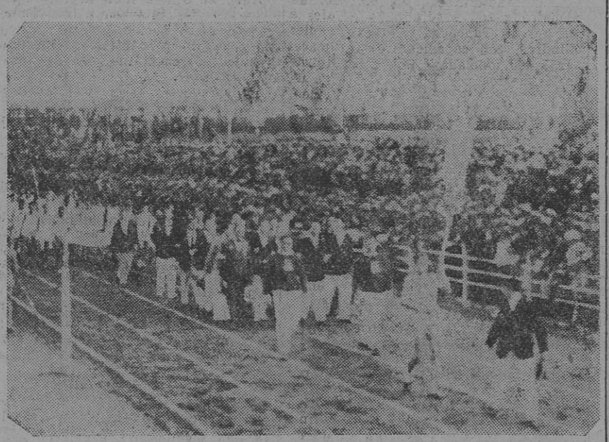
LA DELEGACION DE LA FEDERACION ATLETICA ARGENTINA en el desfile de las representaciones que intervinieron en el VII Campeonato Latinoamericano de Atletismo

do puostos del salto en alto, pues están pendientes de resolución.