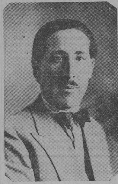
Concejal socialista de Mercedes

tra política y hunde sin remedio a todo el país... ¡Hay que matar la maciega!... Recalcó.