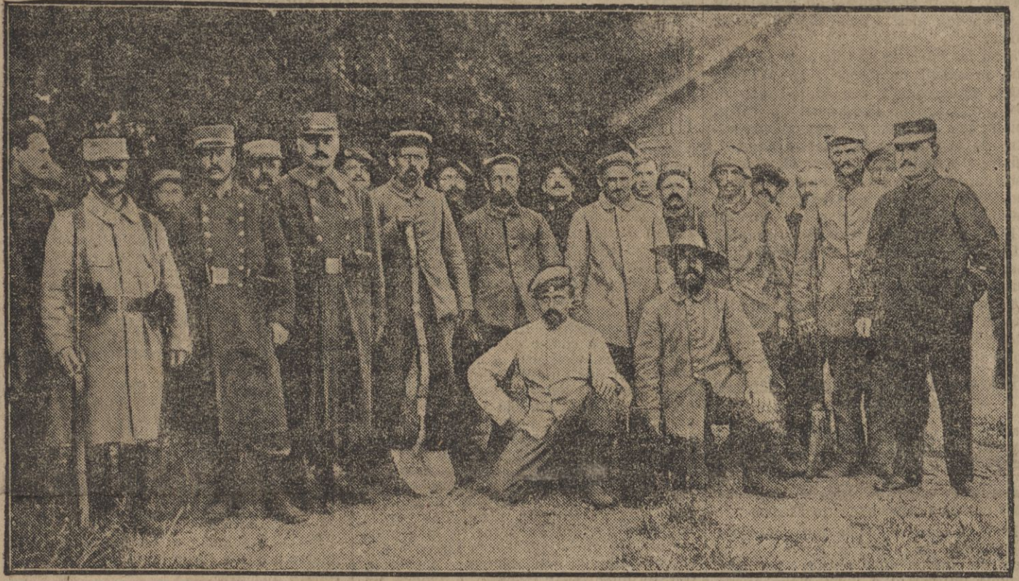
GRUPE D'ALLEMANDS PRIS A EMBERMENIL.