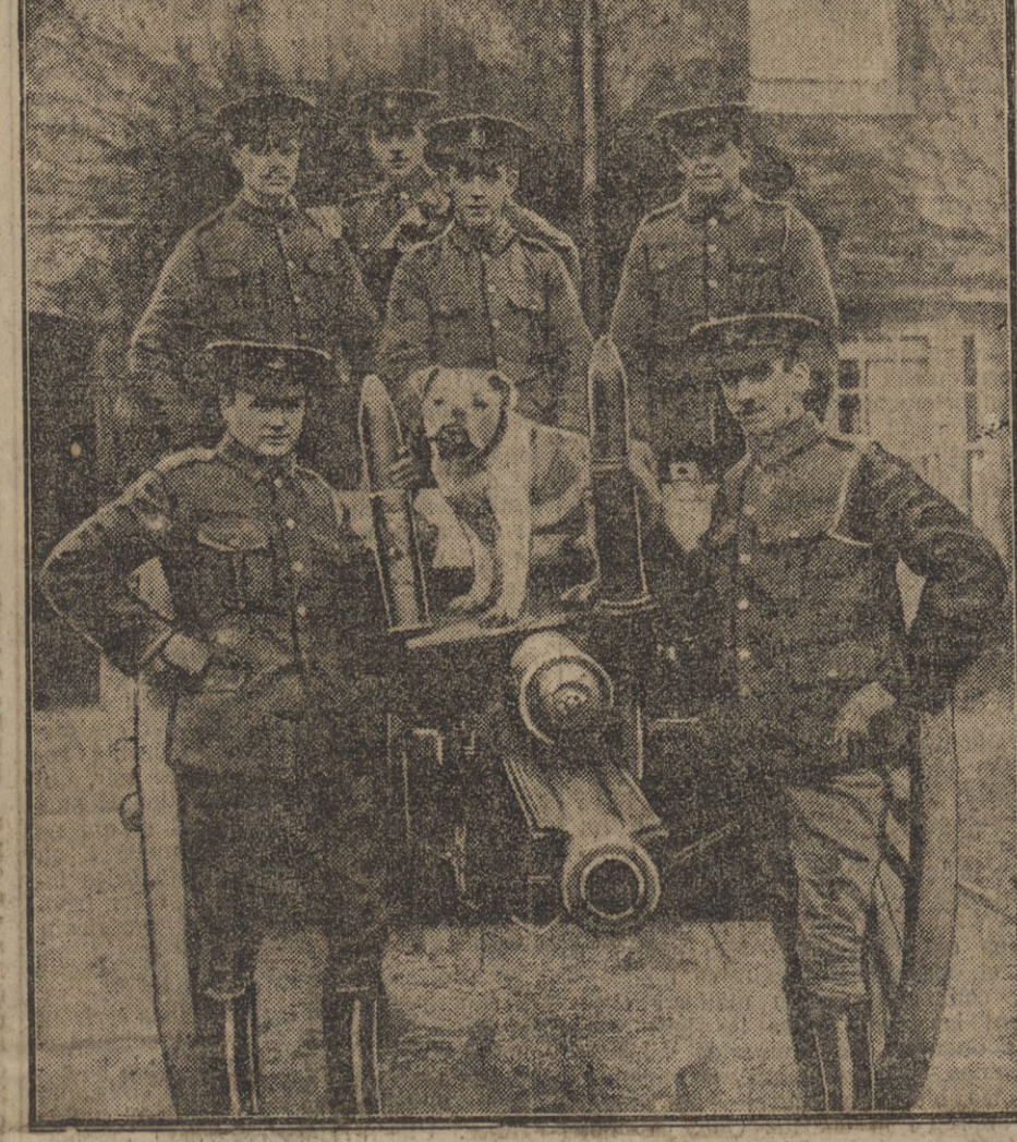
Un canon de campagne avec ses servants et son chien « mascotte ».