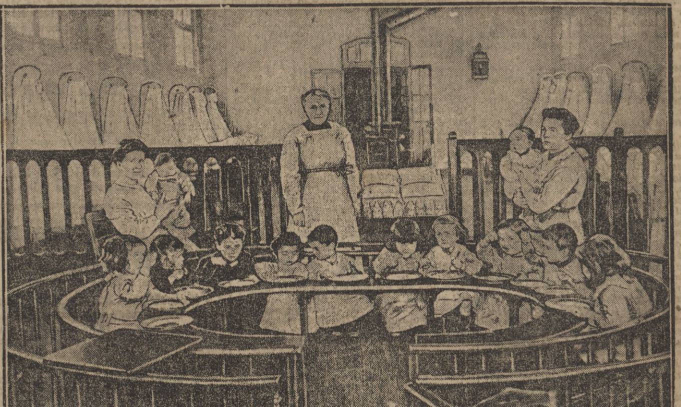
LA SOUPE DU MATIN DANS UNE ŒUVRE D'ASSISTANCE AUX REFUGIÉS.