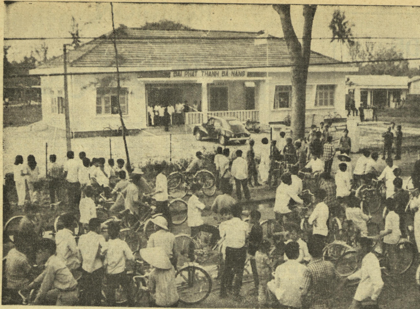
La maison de la Radio aux mains des étudiants.