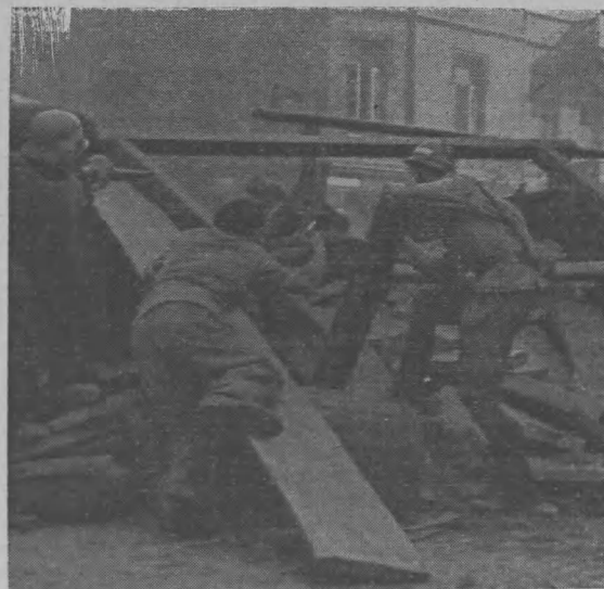
Wkraczające do Warszawy oddziały armii hitlerowskiej napotykały na zdecydowany opór polskich żołnierzy