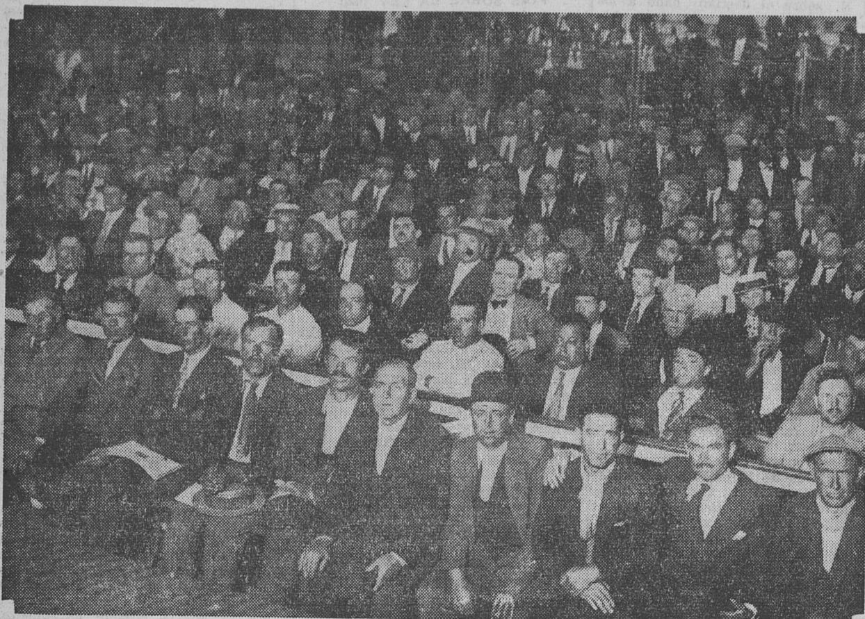
VISTA PARCIAL DE LA CONCURRENCIA QUE ASISTIO AL ACTO ORGANIZADO PARA EL DIA DE AYER POR LOS TRABAJADORES DEL ESTADO.

toda reducción de salarios significa privar a la clase trabajadora de los recursos necesarios para reabsorber su propia producción dando como resultado la restricción del consumo, el