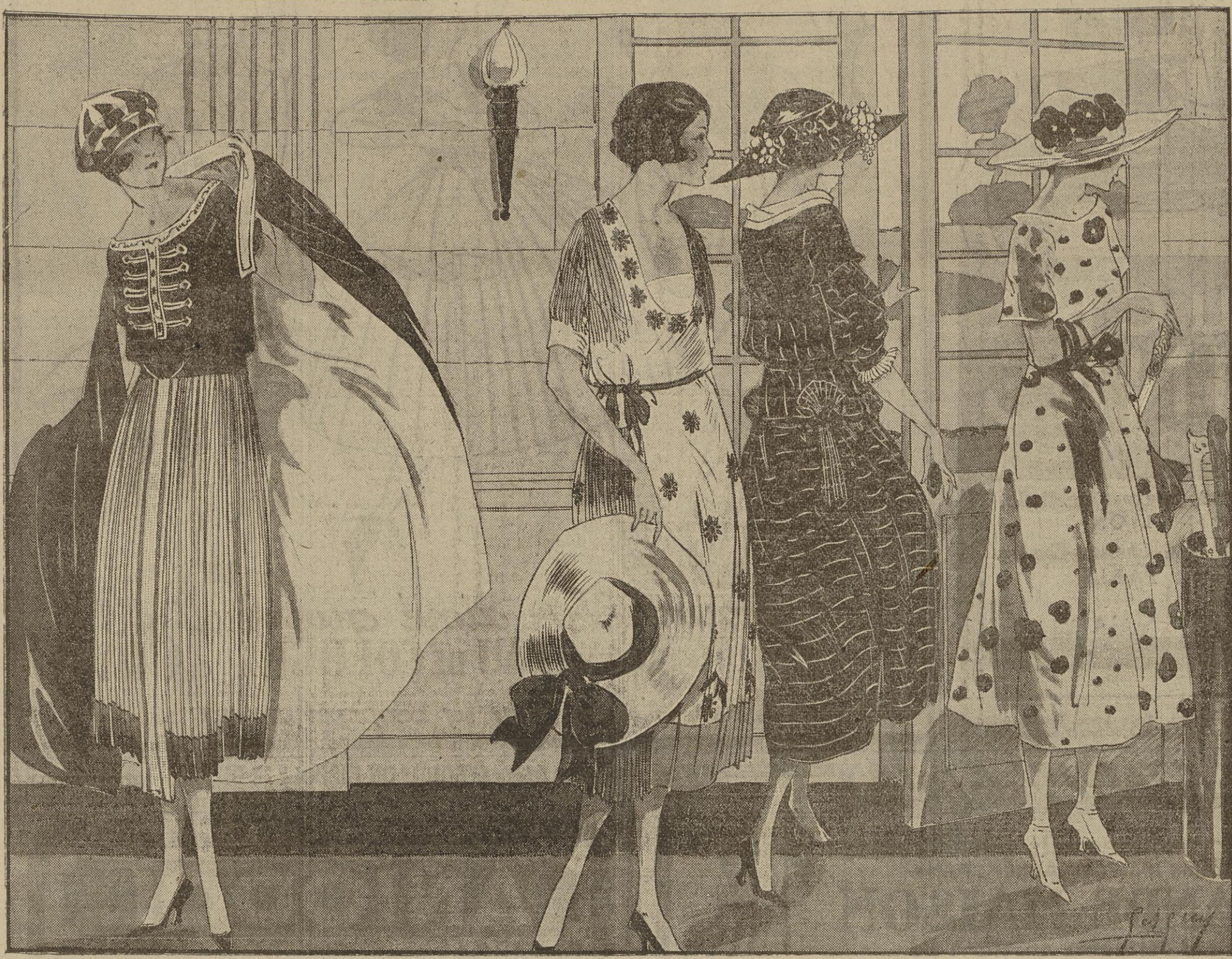
Robe de kasha vert et serge blanche plissée. Cape de kasha assortie. — PREMET.