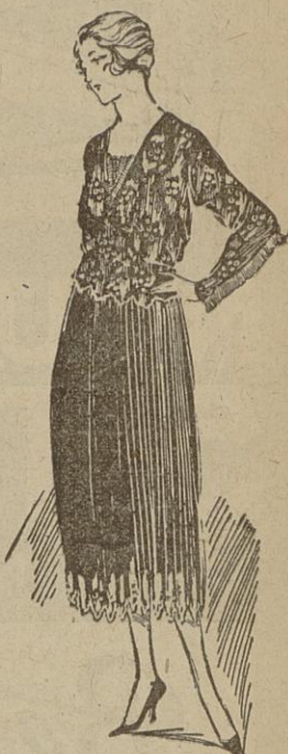
MODÈLE JOSEPH PAQUIN Robe de taffetas marine brodée de blanc

Du reste, je vous ai dit que Joseph Paquin montrait dans sa nouvelle collection d'été des modèles de taffetas particulièrement séduisants et d'une variété exquise. Les corsés, eux, sont de plus en plus simples: pas de fanfreluches, peu de dentelle; une bordure de ruban, un cache-point de roco, un minuscule bouillon bordé la gaine Parabère, que toutes les femmes élégantes portent actuellement sous leur robe. C'est, entre toutes les gaines qu'on propose actuellement, à mon avis, celle qui mérite le mieux son succès. — J. F.