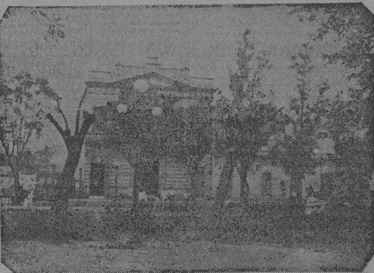
Cómo ha quedado la plaza 9 de Julio, con sus árboles tronchados y talados, luego de realizado el insólito plan de "embellecimiento" edilicio.

No nos mueve a este comentario tanto la destrucción de la plaza, que comprobamos con las fotografías que acompañamos, sino la enormidad que significa la inversión de los dineros públicos en obras de esa naturaleza — pues hay quienes afirman que se invertirán en esos trabajos de 50 a 60.000 pesos —, cuando los barrios suburbanos de Posadas se debaten en el más absoluto abandono por parte de la acción comunal. Hay en esos barrios infinidad de arterias que ni a pie se pueden transitar; hay pantanos que son verdaderos viveros de mosquitos y otras inmundicias; es deficiente el alumbrado público y hay, lo que es verdaderamente grave, una infinidad de hogares humildes cuyos hombres sufren las consecuencias de la desocupación, viviendo en la más desesperante miseria.