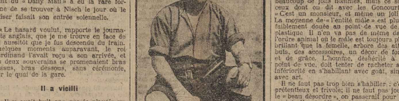
Un beau type de Soldat australien.