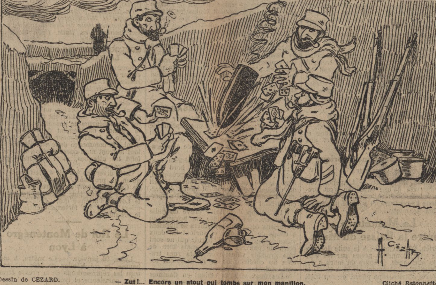
Dessein de CEZARD. — Zut !... Encore un atout qui tombe sur mon mantillon.