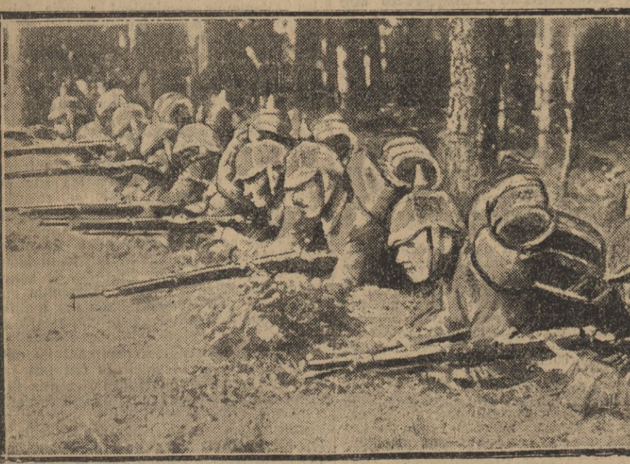
SOLDATS ALLEMANDS DANS DES TRANCHÉES