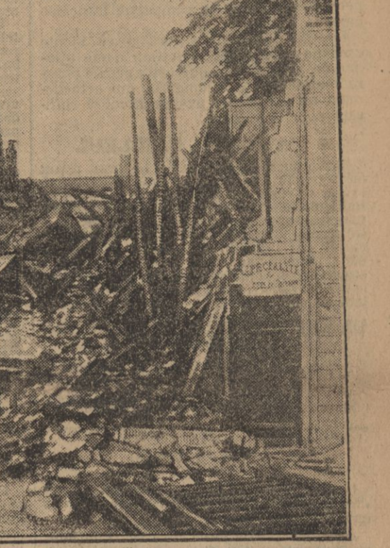
DE QUI RESTE DE LA BOUTIQUE D'UN ÉPICIER