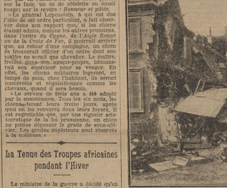
DE QUI RESTE DE LA BOUTIQUE D'UN ÉPICIER