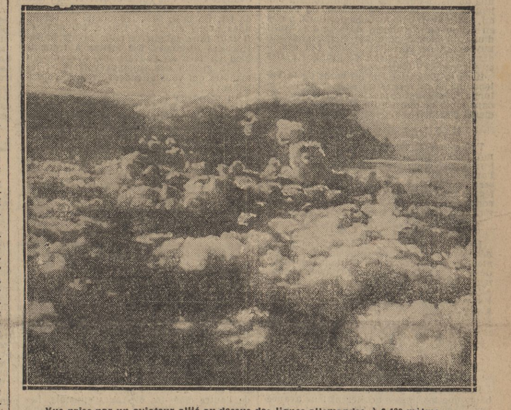
Vue prise par un aviateur allié au-dessus des lignes allemandes, à 2.400 mètres de hauteur.

tre, par conséquent. L'offensive allemande en Pologne est entravée depuis un mois, et les Russes préparent une nouvelle offensive. Ils continuent à avancer en Galicie et dans les Carpates, et l'armée turque du Caucase a été en grande partie anéantie. Les attaques dont on menaçait l'Egypte sont vouées à une impuissance certaine. On ne sait même pas si elles ont osé se produire.