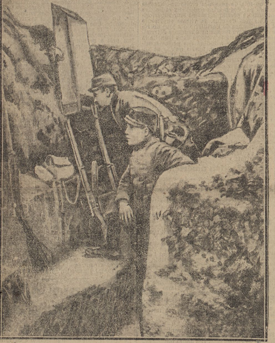
Le Périscope est un instrument qui permet à nos soldats d'observer, sans s'exposer inutilement, ce qui se passe devant nos lignes.