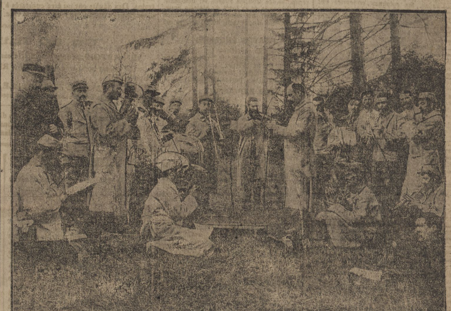
UN CONCERT ORGANISE PAR QUELQUES POILUS DU XVIII e CORPS