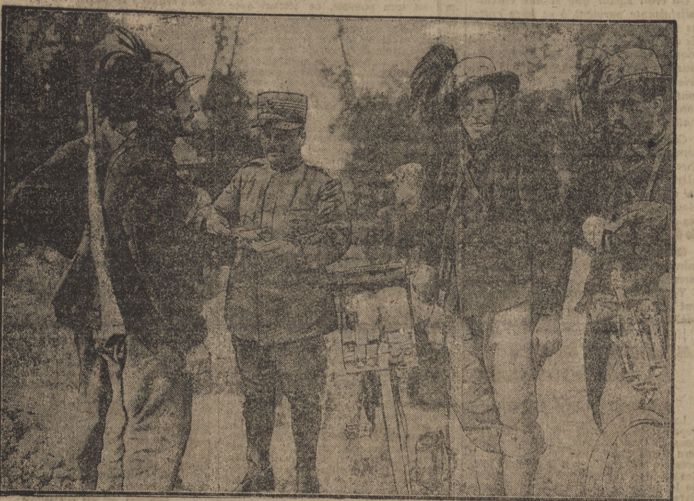
UNE PHARMACIE AMBULANTE EN GARNIE