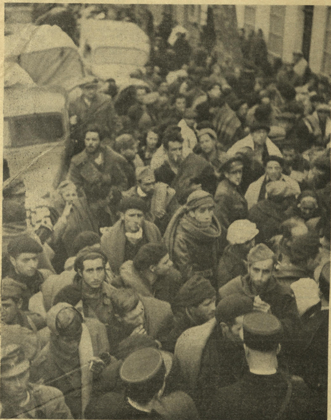
Le chef de l'Etat pense-t-il devoir faire remettre en état les camps de concentration de Barcarès, Argelès, St-Cyprien, Gurs ?