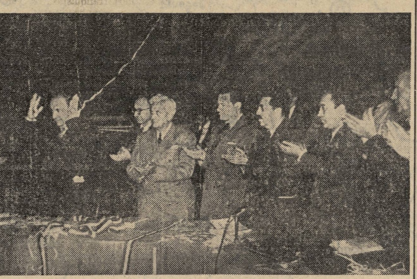
Pablo Neruda, aclamado por el Congreso.

«Sin embargo, muy pronto, grandes potencias fijan su atención en aquel territorio delgado y herido. Así pasó en el mes de junio de este año. Dos grandes naciones quisieron invitar en ese instante a dos chilenos. El Gobierno de los Estados Unidos de América del Norte invitó al general en jefe del Ejército chileno. Yo no soy general; soy, simplemente, un poeta, y, sin embargo, en aquel instante una gran Nación me invitó a visitarla. Esta Nación fue la Unión Soviética, y casi en las mismas horas en que el general chileno se dirigía a humear desde lejos la bomba atómica, yo volaba a celebrar el aniversario de un antiguo poeta, de un profundo y pacífico