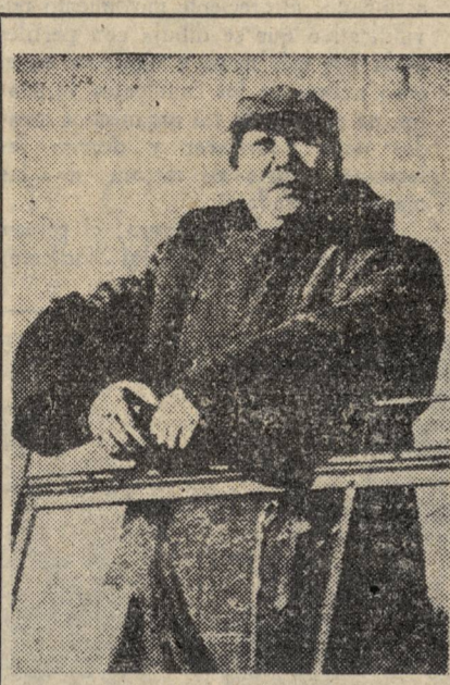
Mao Tse Tung.

Junto a la U.R.S.S., al lado de su fuerza y de su razón, ¡redoblemos la batalla para hacer retroceder a los incendiarios imperialistas de la guerra, para batir todos sus planes y preparativos y para forzarlos a aceptar la paz, la democracia y la cooperación internacionales !