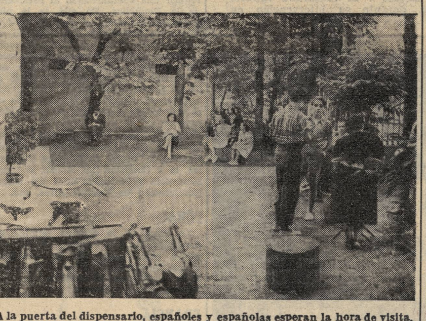
A la puerta del dispensario, españoles y españolas esperan la hora de visita.