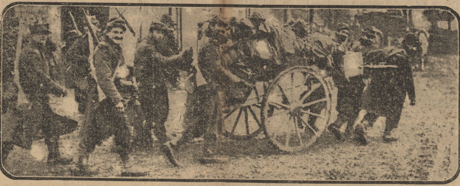
Mes braves lignards traînent dans une charrette à bras les vivres de la compagnie.