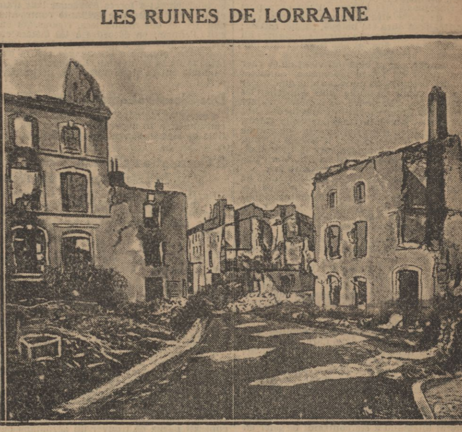
UNE RUE DE GERZEVILLERS

Le 26 octobre, une colonne française sortant d'Ypres se dirigeait sur la route de Houthulst. Le mouvement avait pour but l'attaque des forces allemandes massées au sud de la forêt d'Houthulst.