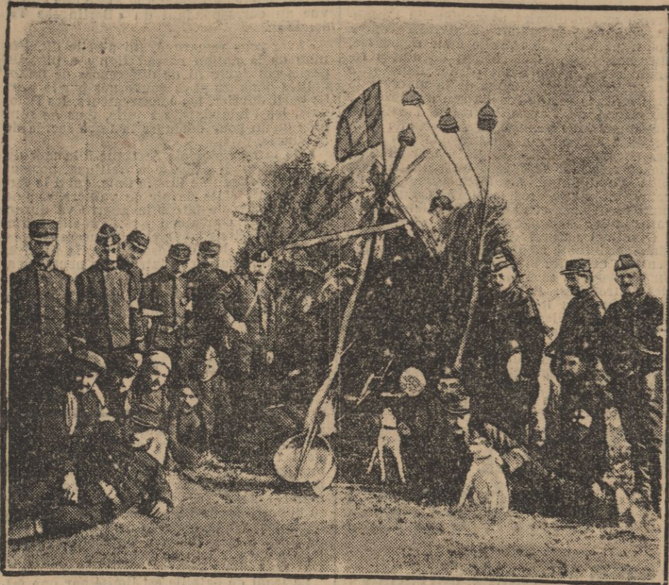
UN ABRI DE BRANCHAGES ORNE DE CASQUES A POINTE