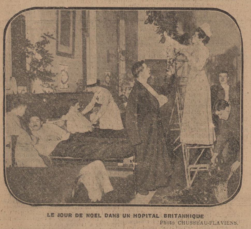
LE JOUR DE NOEL DANS UN HOPITAL BRITANNIQUE

Des pieds, passons à la tête; des chaussures aux colliers. Voici un autre hall immense qui, avant la guerre, voyait de brillantes manifestations sportives.