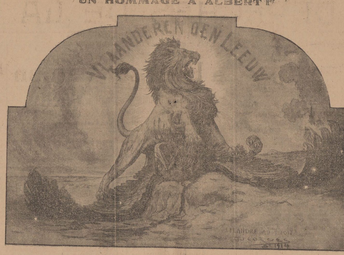
VLAANDEREN DEN LEEUW — « FLANDRE AU LION »