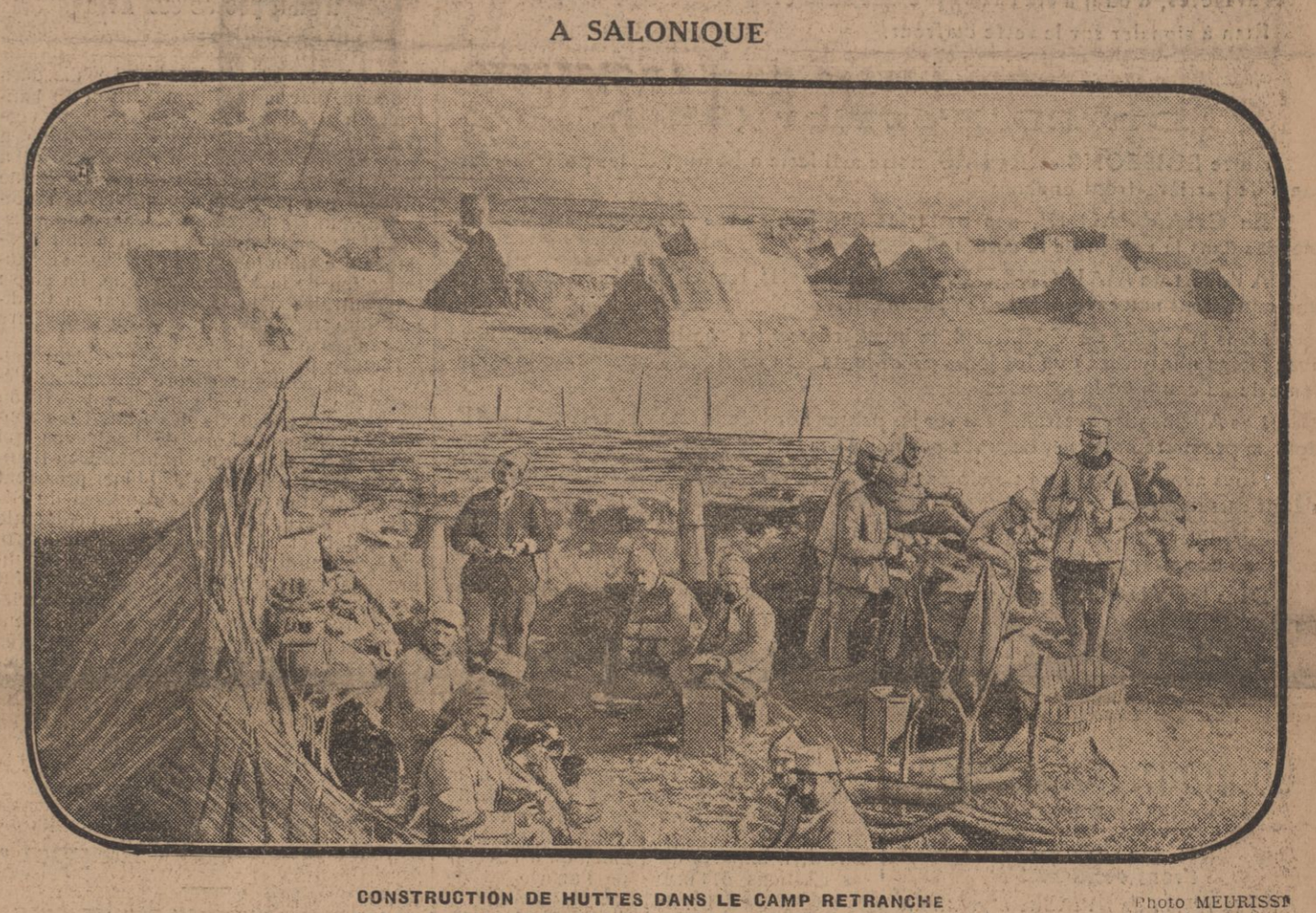
CONSTRUCTION DE HUTTES DANS LE CAMP RETRANCHE

— Vous grand-mère a dit cela ? — Elle le dit tous les jours. — Je n'aurais tant qu'elle ne m'aimait pas, tant qu'elle ne m'appelait de si cruels surnoms.