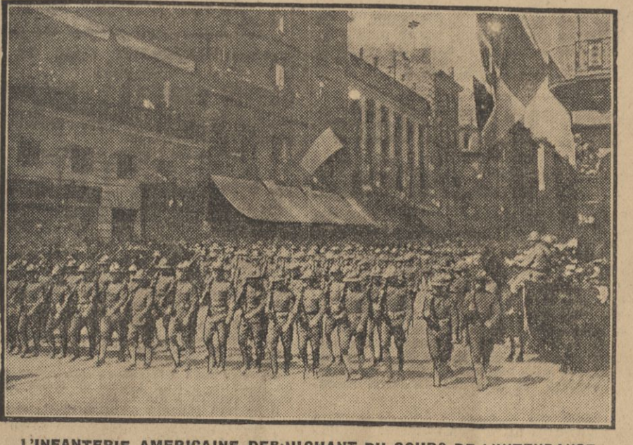
L'INFANTERIE AMERICAINE DEBOUTANT DU COURS DE L'INTENDANCE