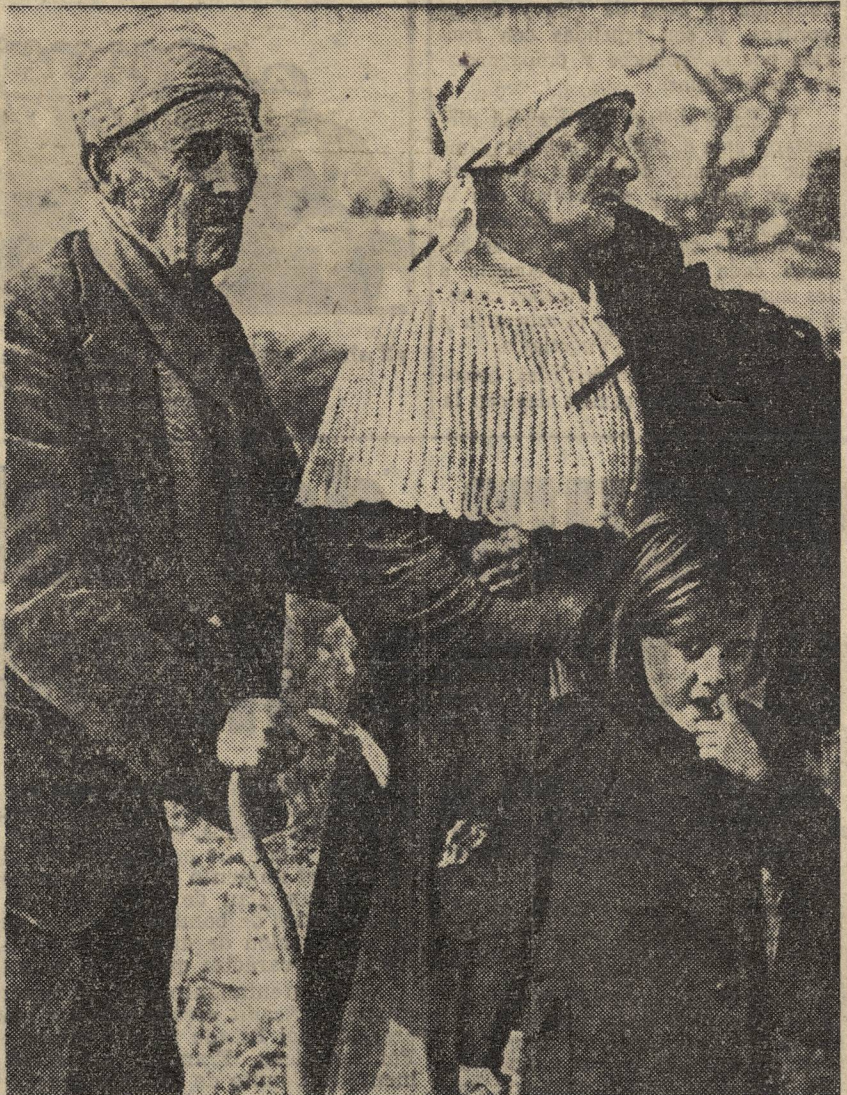
CAMPESINOS ARAGONESES. — Con la invasión nazi-franquista empezó su cruel peregrinar. La tragedia sigue y se agrava. Ejemplo: Los Monegos

Ahora bien: Con ese racionamiento es imposible vivir ni siquiera una semana. Por ello el pueblo tiene que recurrir al estraperlo pagando precios fabulosos. Por ejemplo, mientras que los precios de las alubias en ese misero racionamiento — que Franco utiliza para sus estadísticas — son de 7 pesetas el kilo, en el estraperlo cuestan 15; y los garbanzos que de racionamiento valen 7,50 en el estraperlo hay que pagarlos a 20. Y así por el estilo. Franco miente una vez más. No es a un 462,6 por cien, a lo que se ha elevado el nivel de vida. SE HA ELEVADO REALMENTE A MAS DE UN MIL POR CIENTO. Los que saben el índice real de la vida en España son las mujeres de obreros y de los trabajadores a quienes las cifras dadas por el franquismo habrán indignado aún más, pues son una burla descarada y cínica.