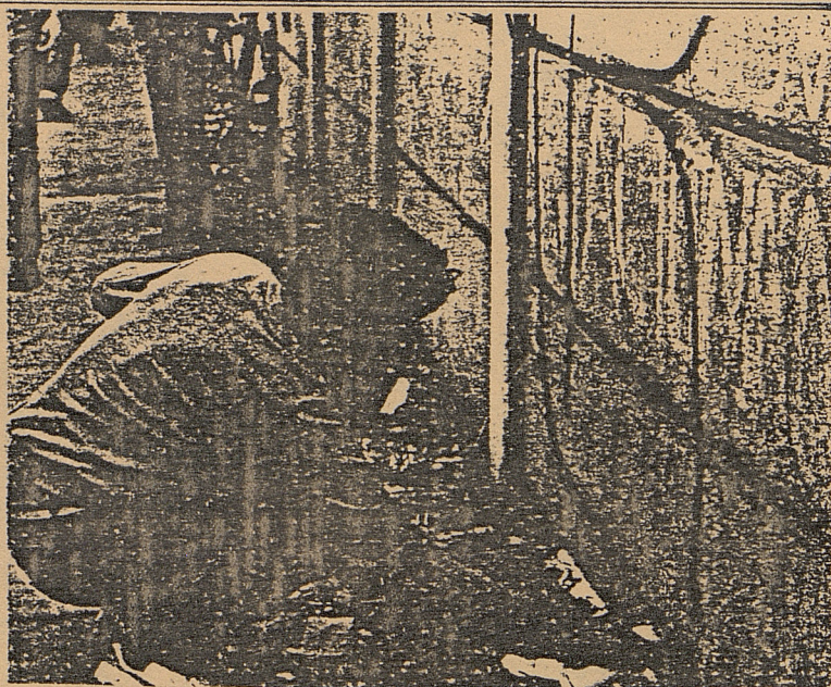
CHILE: Denuncia a través de rayados

El problema de la unidad debiera ser una constante preocupación de todos los chilenos en el exilio, es grave constatar el poco diálogo y participación que tienen algunos sectores nuevos de la política chilena, ninguna solución será verdadera sin la participación de todos los sectores y corrientes de opinión y nada se saca con cerrarse y crear superestructuras que a la larga se alejan de la realidad que vive Chile.